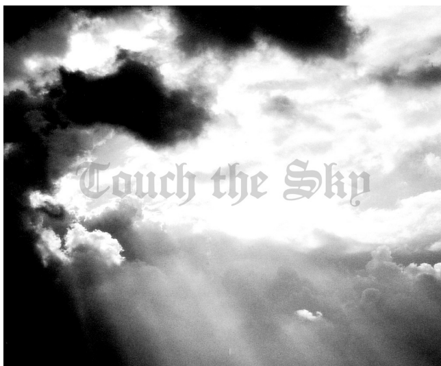
Angélique Lecaille, Touch the sky , 2006, dessin à la mine de plomb, 305x155cm. Production : 40mcube. © Angélique Lecaille.