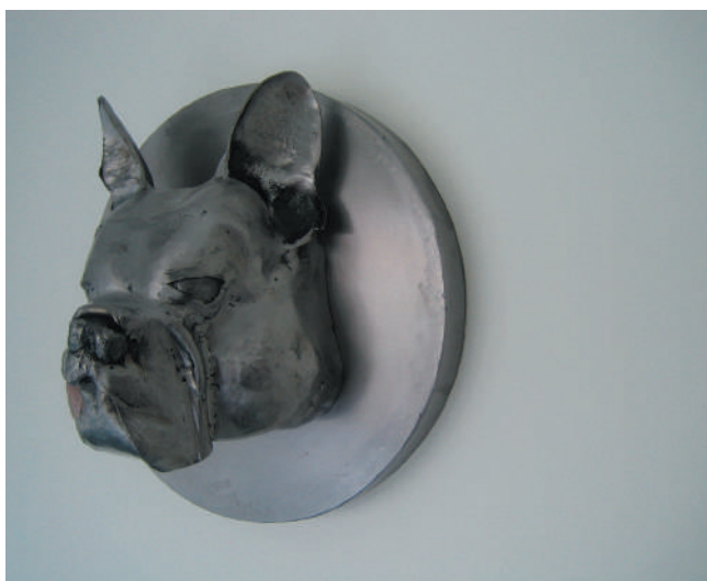
Delphine Lecamp, Naïv (détail), 2006, acier doux martelé, 130x30cm. Production : 40mcube, Ecole supérieure d'art de Nantes. © Delphine Lecamp.