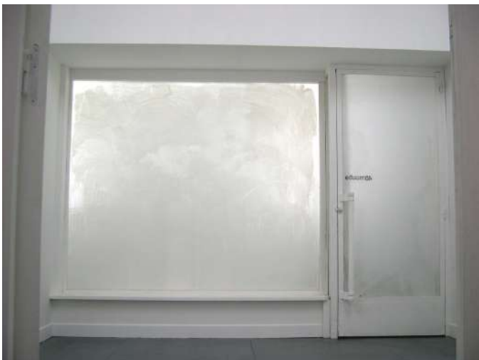
Novo ex novo, 2004. 40mcube, Rennes. Salle 1 / Salle 2.