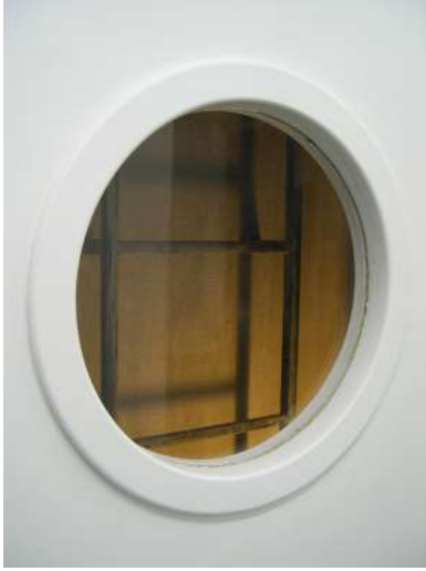
Recesses monitoring, 2006. Glassbox, Paris.