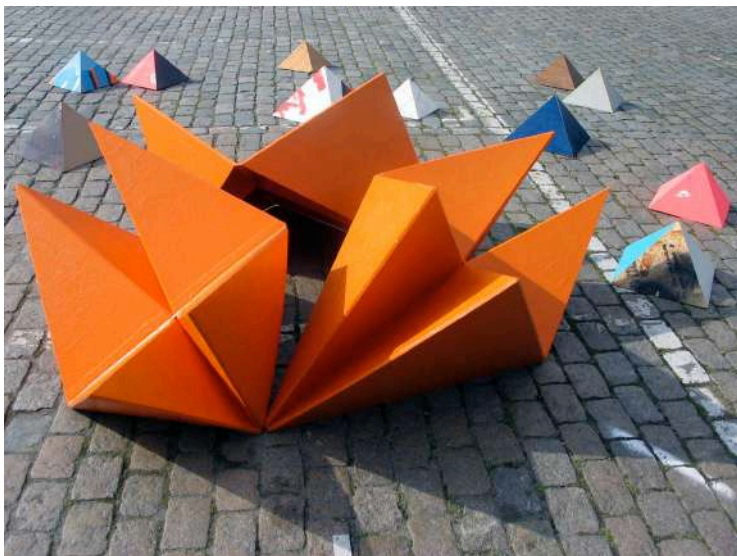
Samir Mougas, Strategy & Tactics , 2009. Production : 40mcube