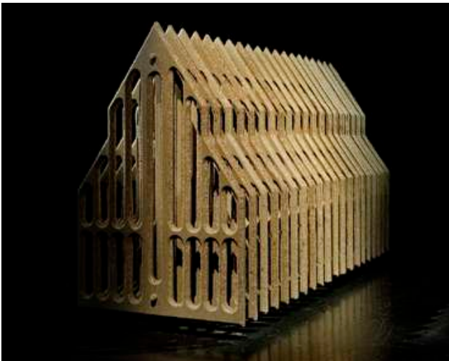
Sarah Fauguet & David Cousinard, Time Line , 2009. Plâtre, BA10, acier, verre, bois. 745 x 450 x 265 cm. Vue de l'exposition Time Line , Tripode (Rézé).