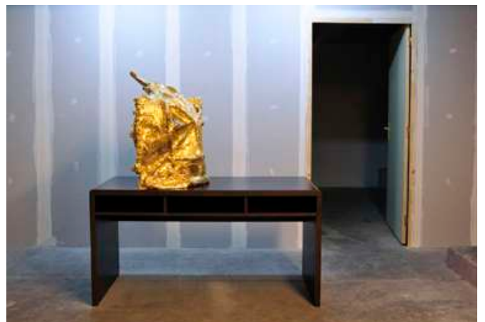
Sarah Fauguet & David Cousinard, Silent Rejection , 2010. Bois, acier, plâtre, feuilles d'or, placages. Dimensions variables. Vue de l'exposition L'État de surface , Instants Chavirés (Montreuil).