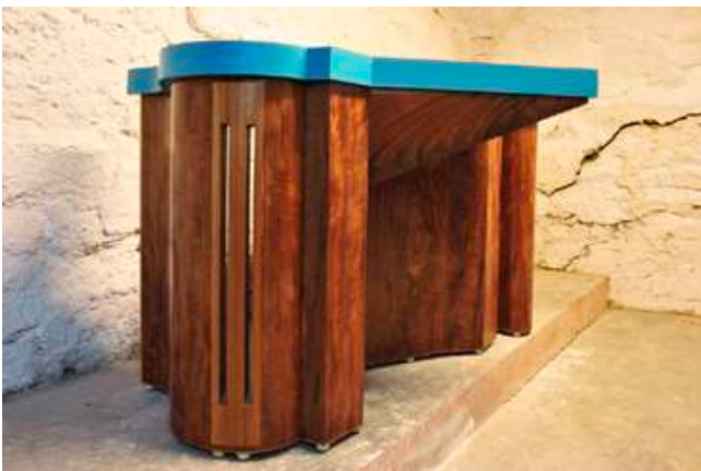
Sarah Fauguet & David Cousinard, Silent Rejection , 2010. Bois, acier, plâtre, feuilles d'or, placages. Dimensions variables. Vue de l'exposition L'État de surface , Instants Chavirés (Montreuil).