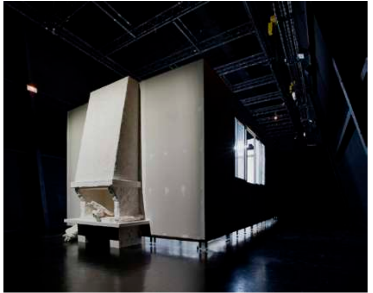
Sarah Fauguet & David Cousinard, Time Line , 2009. Plâtre, BA10, acier, verre, bois. 745 x 450 x 265 cm. Vue de l'exposition Time Line , Tripode (Rézé).