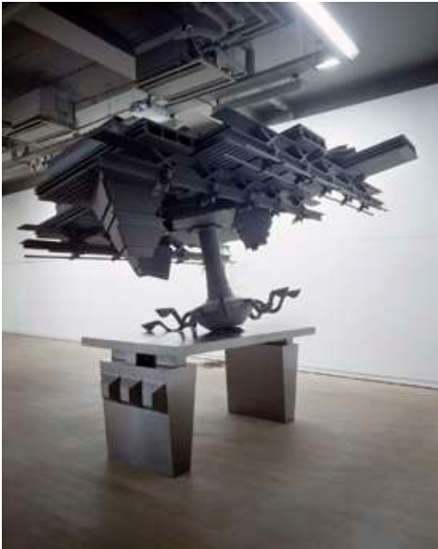
Sarah Fauguet & David Cousinard, Sans titre , 2008. Mdf teinté dans la masse et métal. Vue de l'exposition Et pour quelques dollars de plus... , Fondation d'entreprise Ricard (Paris).