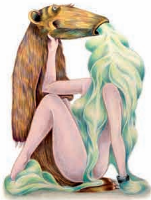
Hippolyte Hentgen, Le Tapir , 2010, crayon de couleur sur papier, 61 × 41 cm.