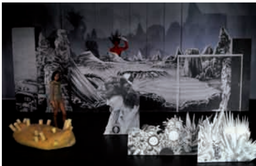
Décor réalisé par Hippolyte Hentgen pour la pièce Mars-Watchers , Compagnie John Corporation, 2012.