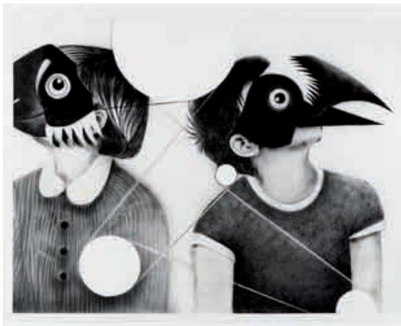
Hippolyte Hentgen, dessin de la série Les enfants de septembre (d'après Paper Faces de Michael Grater, 1968), 2012.