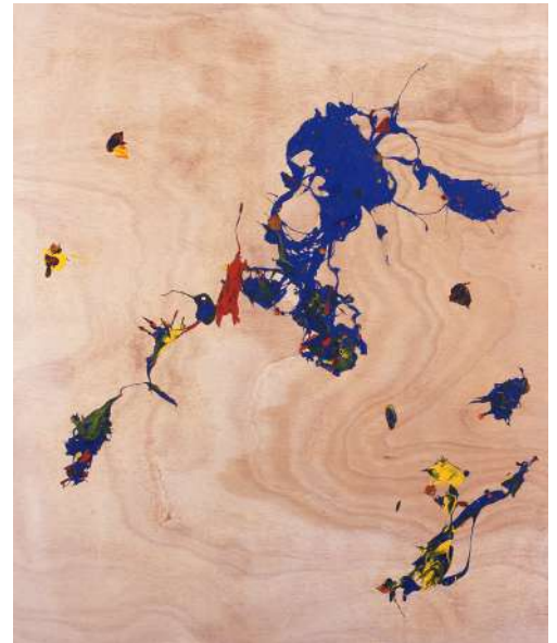
Jimmie Durham, Almost Spontaneous , 2004, peinture acrylique fixée sur bois, colle et agrafes, 120 x 100 cm. Inv. FNAC 05-520. © Jimmie Durham / CNAP.

Ses sculptures, installations, peintures et vidéos intègrent ou utilisent souvent des matériaux naturels ou manufacturés, détournés de leur fonction originelle pour être engagés dans un geste de remise en cause contestataire des systèmes établis. Cette dimension performative, teintée d'humour et d'un soupçon de violence, est bien présente dans la série Almost Spontaneous (2004), dont les projections colorées maculant des panneaux de bois résultent de la chute d'une pierre dans un seau de peinture. La pierre, élément récurrent dans les œuvres de Jimmie Durham, est ainsi tirée de l'immobilité inhérente à tout minéral afin de la transformer « presque spontanément » en un outil actif, générateur d'art. De ce processus théâtral et ancestral, quasi exempt de maîtrise technique, ne subsistent que ces peintures expressives et abstraites. Elles constituent les vestiges d'un acte dont les acteurs – la pierre comme l'artiste – se sont retirés, abandonnant toute autorité. E. B.