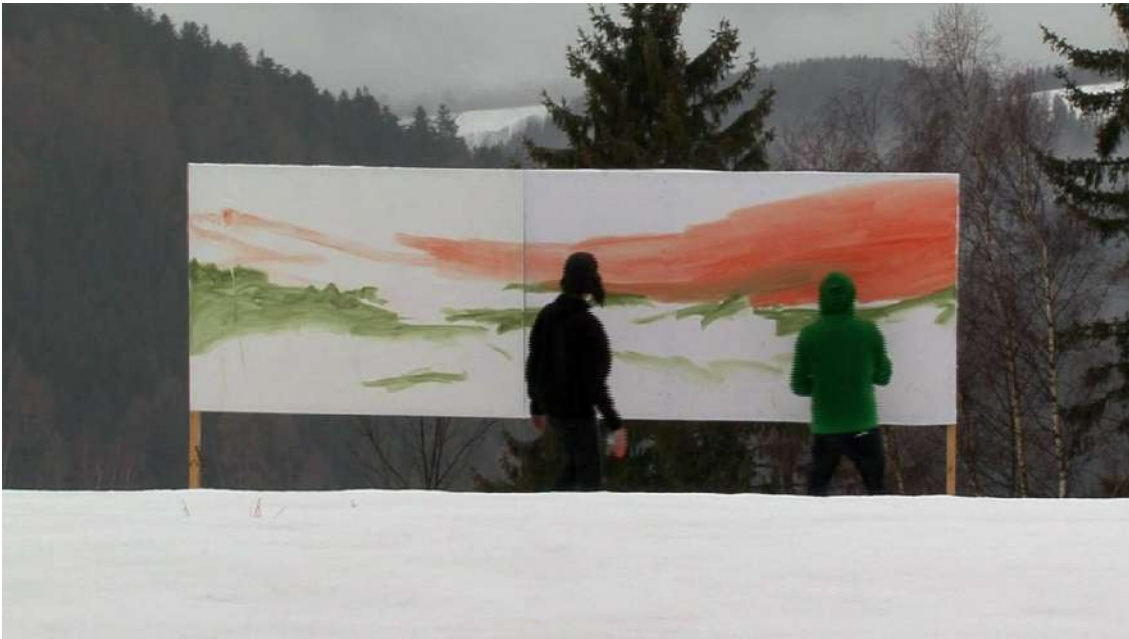
We Are The Painters, Paint for Hochwechsel , 2010, vidéo, HDV, couleur, son. Durée : 47'54". Inv. FNAC : 2012-280.

We Are The Painters est représenté par New Galerie (Paris, New York)