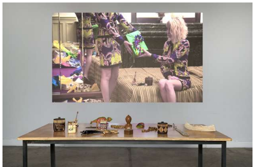
Lili Reynaud-Dewar, Inaccurencies , 2010, installation vidéo, bois, métal, plastique, tissus, rafia, vidéo couleur avec son, lettre encadrée : 37 x 125 cm, table : 75 x 184 x 84 cm. Inv. FNAC 2012-179. © Lili Reynaud Dewar / CNAP. Photo courtesy Galerie Kamel Mennour.

Inaccurencies est une installation comprenant des objets-souvenirs de Madagascar ainsi qu'une vidéo représentant deux femmes qui déballetent des paquets cadeaux de souvenirs, les rangent dans une valise, puis partent en forêt afin de les brûler dans un simulacre de sacrifice. Les objets sont exposés sur une table et les costumes des deux femmes accrochés au mur comme des fétiches.