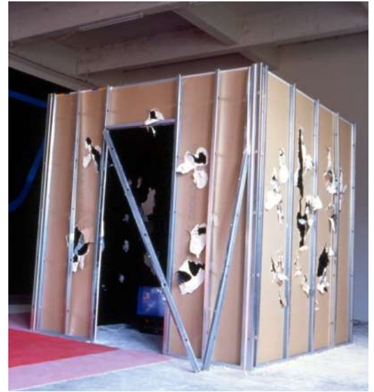
Steven Parrino, Trashed Black Box n°2 , 2003, caisson muni d'une ouverture construit en plaques de placo-plâtre laquées noir sur leur face interne et endommagées de l'intérieur à l'aide d'une masse, placo-plâtre, aluminium et laque noire, 250 x 240 x 240 cm.

Trashed Black Box n°2 est une cabane en placo-plâtre dont les parois ont été trouées à la masse. L'œuvre est une sculpture in progress qui porte en elle et sur elle les traces de ses interventions, manipulations et déchirures, qui constituent tant son histoire que son actualité. Ainsi l'œuvre résulte de son propre processus de fabrication et propose, au travers de ses exactions, un constat sur l'état de son existence et sur la condition de sa création.