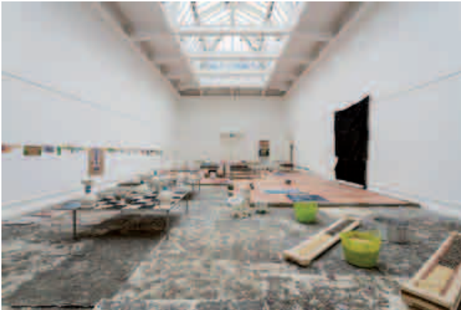
Oscar Murillo, If I was to draw a line, this journey started approximately 400 km north of the equator , 2013. Vue de l'installation à la South London Gallery.