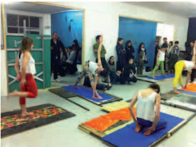
Oscar Murillo, Animals die from eating too much! yoga , 2011, performance réalisée à Hotel (Londres).