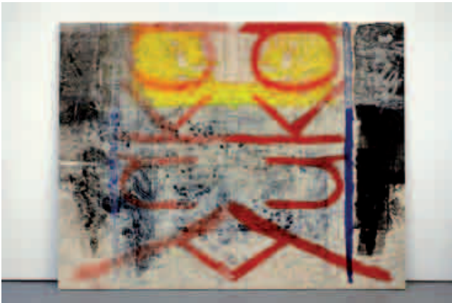
Oscar Murillo, Untitled , 2012, huile, oil stick et poussière sur toile, 216 x 280 cm.