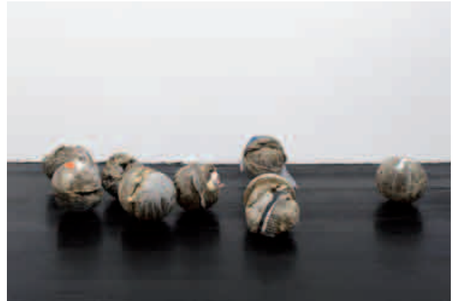
Oscar Murillo, Social Anomalies from a Candy Factory, 2013, béton, cuivre, débris d'atelier, dimensions variables.