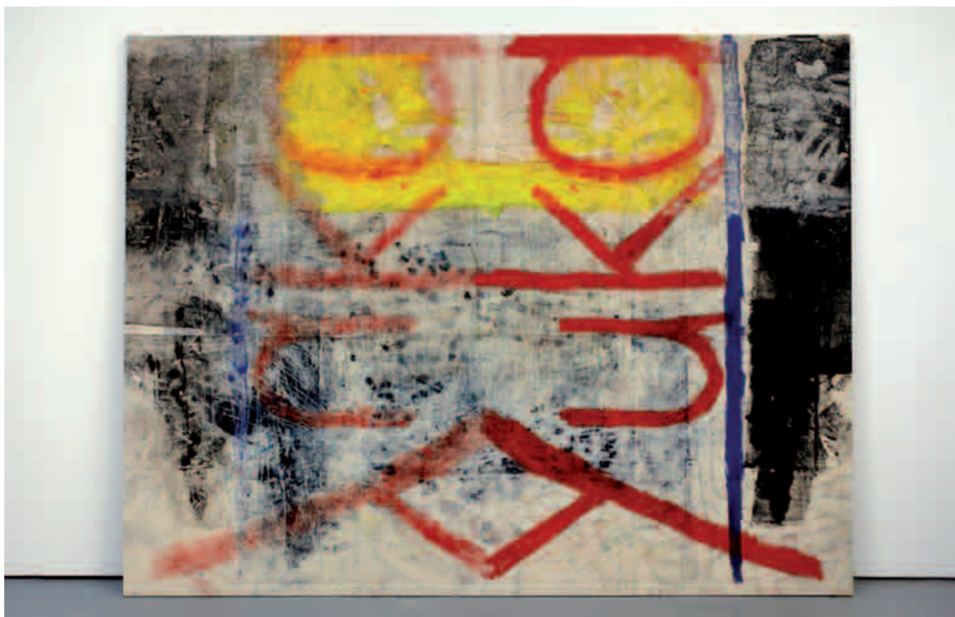
Oscar Murillo, Untitled , 2012, huile, oil stick et poussière sur toile, 216 × 280 cm.