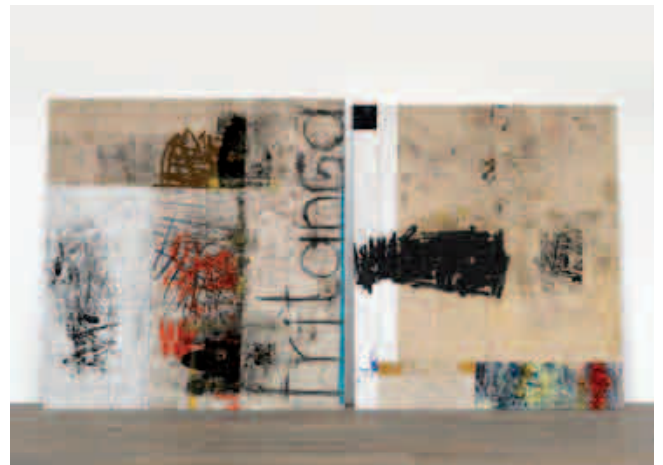
Oscar Murillo, Fry Up (Stack paintings) , 2012, huile, oil stick, graphite, spray paint et poussière sur toile, 245 x 455 cm.