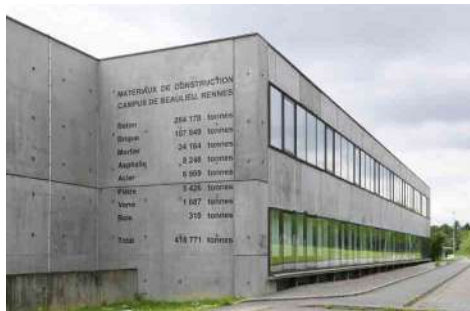
Lara Almarcegui, Matériaux de construction, Campus de Beaulieu, Rennes , 2014, peinture, 508 x 395 cm. Œuvre réalisée dans le cadre de l'action Nouveaux commanditaires initiée par la Fondation de France. Médiation-production : 40mcube et Eternal Network.