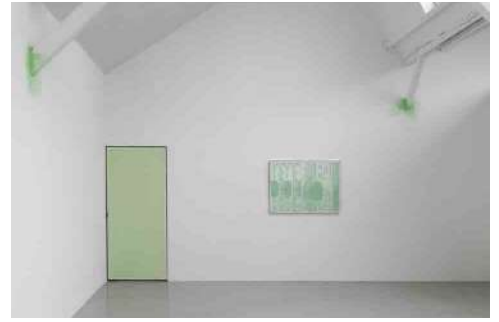
Loïc Raguénès, Avec une bonne prise de conscience des divers segments du corps, votre geste sera plus précis dans l'eau , 2013. Production 40mcube. Commissariat 40mcube.