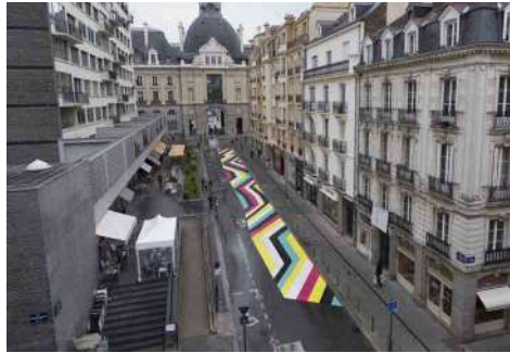
Lang/Baumann, Street Painting #7 , 2013, peinture routière, 59 x 3,7 m. Production 40mcube et PHAKT, avec le mécénat de Signature et Identic et avec le soutien de la Ville de Rennes et de Pro Helvetia, Fondation suisse pour la culture.