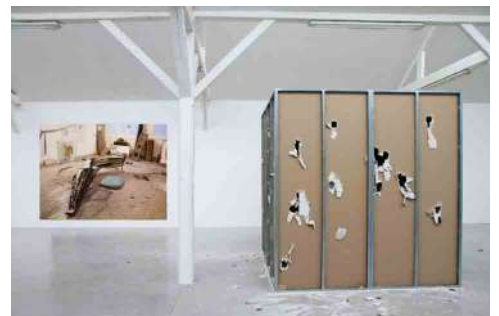
(À gauche) Emmanuelle Lainé, Effet Cocktail , 2011, fichiers numériques et épreuves Lambda, dimensions variables. Inv. FNAC AP12-1 (15). © Emmanuelle Lainé / CNAP. (À droite) Steven Parrino, Trashed Black Box n°2 , 2003, caisson muni d'une ouverture, construit en plaques de placo-plâtre laquées noir sur leur face interne et endommagées de l'intérieur à l'aide d'une masse, placo-plâtre, aluminium et laque noire, 250 x 240 x 240 cm. © D.R. / CNAP. Photo : Patrice Goasduff.