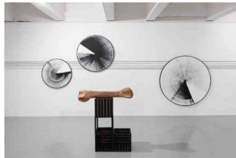
Claudia Comte, Sonic Geometry , 2015. Production : 40mcube / galerie Art & Essai, avec le soutien de Pro Helvetia - Fondation suisse pour la culture. Commissariat 40mcube.