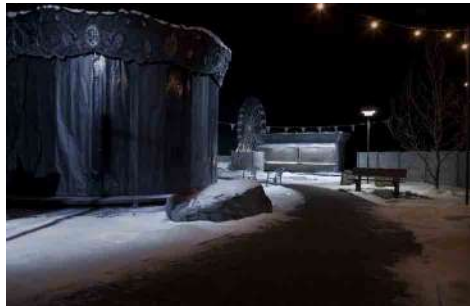
Hans Op de Beeck, The Amusement Park , 2015, installation sculpturale, techniques mixtes, son, 5,2m (hauteur) x 16m (largeur) x 24m (profondeur). Production Les Champs Libres. Commissariat 40mcube. Courtesy Galleria Continua. Photo : DR.