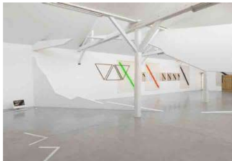
Vue de l'exposition Archeologia , 2013, Louise Hervé & Chloé Maillet, Benoît Maire, Daphné Navarre, Christophe Sarlin. Production 40mcube. Commissariat 40mcube.