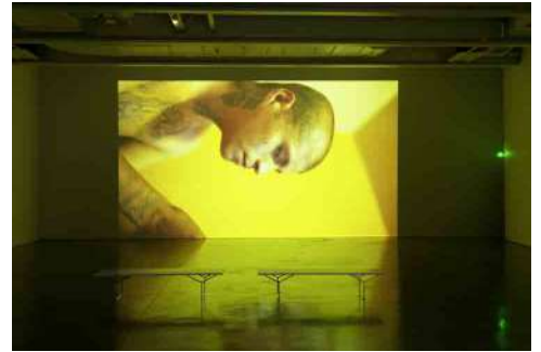
Jean-Charles Hue, Lágrimas Tijuana , 2015. Commissariat 40mcube. Exposition présentée au Frac Bretagne.