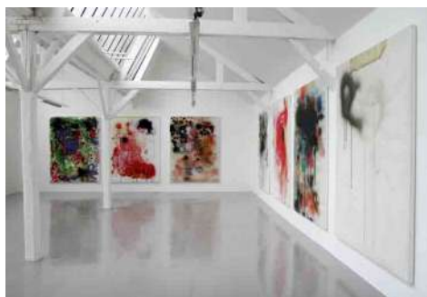
Ida Tursic & Wilfried Mille, Smears , 2011. Production 40mcube. Commissariat 40mcube.