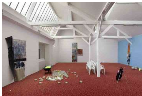
Oscar Murillo, An Average Work Rate with a Failed Goal , 2014, vue de l'exposition. Production 40mcube. Exposition réalisée avec le soutien d'Art Norac dans le cadre des Ateliers de Rennes - Biennale d'art contemporain.