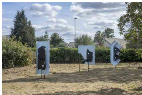
Samir Mougas, Human Experience: Pollution Rising , 2018, réservoirs de carburant, morceaux de piscine découpée, acier, dimensions variables. Production : La Chapelle des Calvairiennes, avec le soutien de HubHug 40mcube.