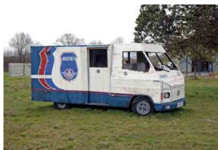
Pascal Rivet, Long Time Parking , 2016. Installation pérenne de l'œuvre Fourgon Brink's , réalisée en 2004, au HubHug Sculpture Project. Réplique à l'échelle 1 d'un fourgon blindé Mercedes-Benz 308 D, voliges de sapin et bois divers peints, 480 x 220 x 200 cm.