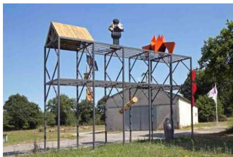
Le Rack , 2017. Production : 40mcube.