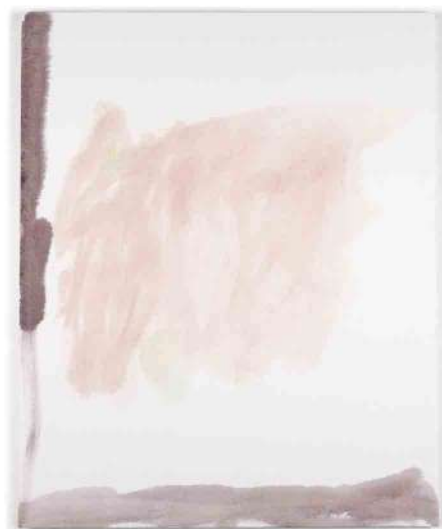
Kahina Loumi, Palette II , 2017, peinture à l'huile sur toile, 80 x 100 cm.