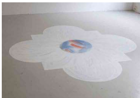
Kahina Loumi, Bassin , 2018, peinture au blanc de Meudon et peinture à l'huile sur plexiglas, 200 x 200 cm.