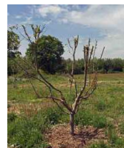
Laurent Duthion, Les réalisateurs , 2008 - ..., arbres vivants polygynés. Production : Château d'Oiron Centre des Monuments Nationaux.