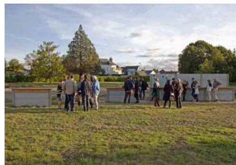
Erwan Mével et Thomas Le Bihan, Buvette Banc , 2016, modules de béton, bois, résine. Production : 40mcube, avec le mécénat de Rousseau Clôtures.