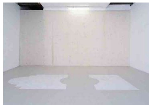
Kahina Loumi, Piscine , 2018, peinture au blanc de Meudon, 160 x 500 cm, L'esprit du jeu , 2018, pigments et liant acrylique sur toile de coton naturel, 320 x 620 cm.