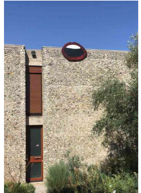
We Are The Painters, Bouche Céleste , 2018, tissu marouflé sur bois, peinture à l'huile, vernis.