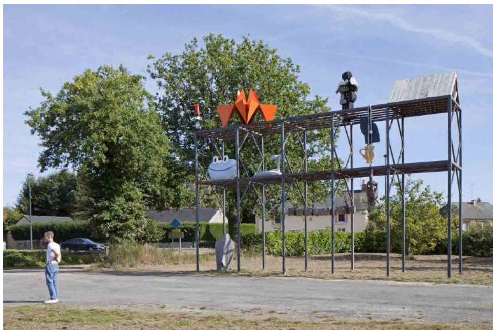
HubHug Sculpture Project, Le Rack.

Inauguré en 2017 avec les œuvres de 18 artistes, le HubHug Sculpture Project accueille deux nouvelles œuvres qui prennent place sur Le Rack : une série de sculptures réalisées en 2018 par Laurence De Leersnyder lors de sa résidence au sein de l'entreprise Rousseau Clôtures coordonnée par 40mcube, et Bouche Céleste , une peinture du duo We Are The Painters qui reprend le motif d'une bouche entrouverte, motif récurrent dans les œuvres des artistes.