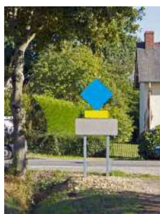
Victor Vialles, Sculpture Sans Titre , 2016, peinture sur aluminium et acier galvanisé, 300 x 130 x 30 cm. Production : 40mcube, avec le mécénat de Self Signal.

Le Rack propose ainsi une exposition permanente ouverte à tous jours et nuit, 7 jours sur 7.