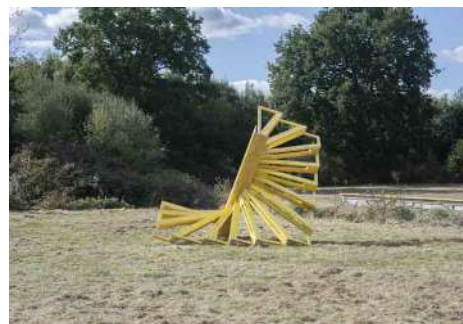
Cyril Zarcone, Volée hélicoïdale N-1 , 2016, bois, visserie, 278 x 278 x 250 cm. Production : Galerie Eric Mouchet.