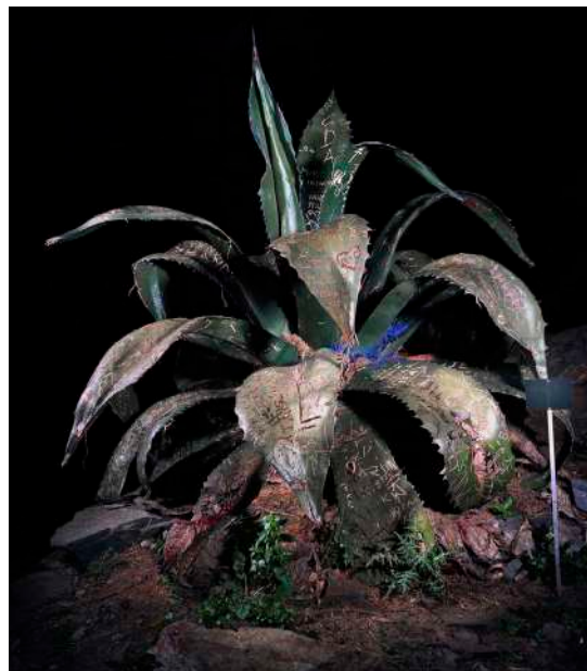
Aurore Valade, SEMPERVIVUM DECORUM / Agave Alain americana communis , 2007. 80 x 65 cm. Tirage lambda.