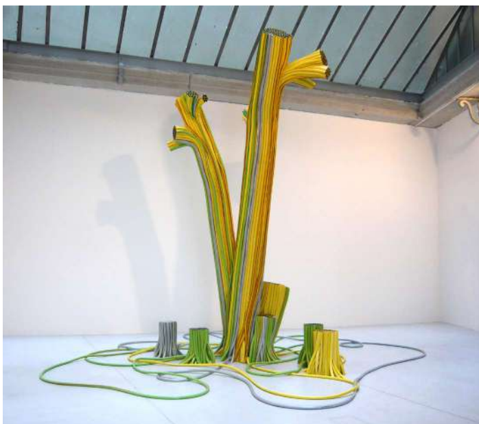
Laurent Perbos, Souche , 2007. Tuyaux d'arrosage en P.V.C. Dimensions variables.