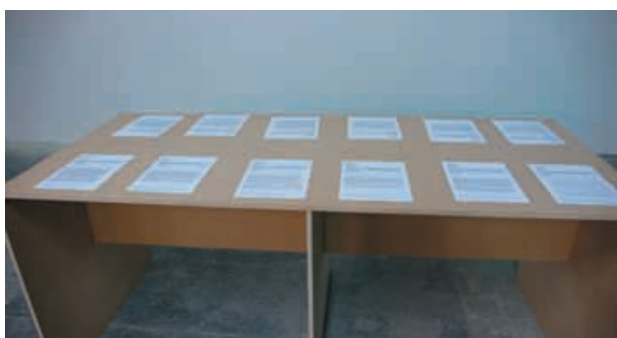
Dora Garcia, Lettres à d'autres planètes , 2008. Production : 40mcube.