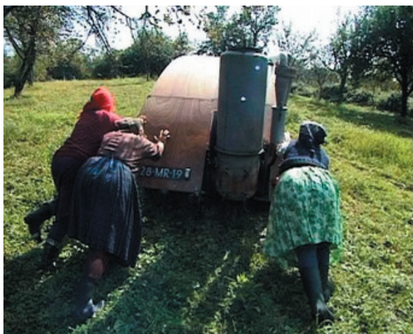
Joost Conijn, Hout auto , 2001.