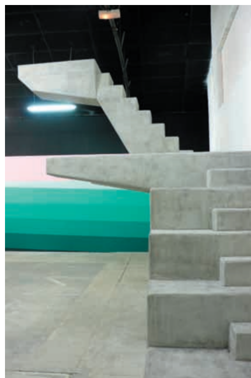
Briac Leprêtre, Plongeur , 2008. Production : 40mcube.