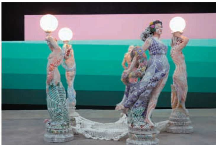
(Premier plan) Joana Vasconcelos, A Ilha dos Amores , 2006. (Second plan) Damien Mazières, sans titre , 2008. Production : 40mcube.