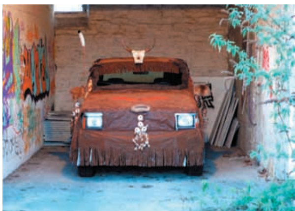
Nicolas Milhé, Cherokee , 2005. Coproductioin : Zebra 3 / 40mcube.