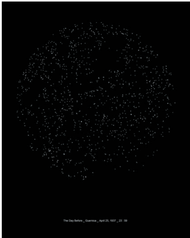
Renaud Auguste-Dormeuil, The day before_Guernica_April 25, 1937_23:59.