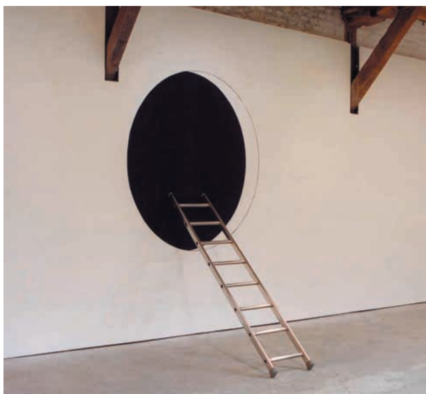
Michel Guillet, Hole black, 2002.