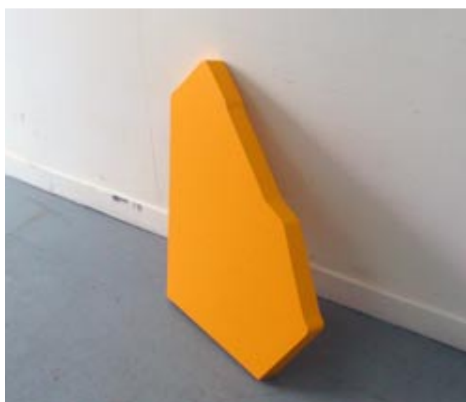
Samir Mougas, Le morceau jaune , 2008, laque polyuréthane, résine polyester, carton, 75 x 65 x 10 cm. Collection privée.