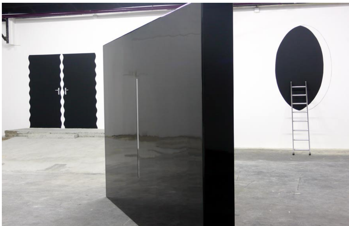
Au fond à gauche, Michel Guillet, Modulations , 2008, production 40mcube, à droite, Michel Guillet, Hole Black , 2002 ; au centre, Nicolas Milhé, Meurtrière , coproduction 40mcube / Buy-Self, 2008.

Jusqu'au 19 juillet 2008 ZAC 40mcube 39-40 avenue Sergent Maginot