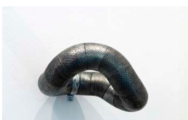
Antoine Dorotte, Suite d'O , 2010. Eau-forte sur zinc. Dimensions variables. Courtesy de l'artiste / Galerie ACDC (Bordeaux). Photo : Pierre Antoine.