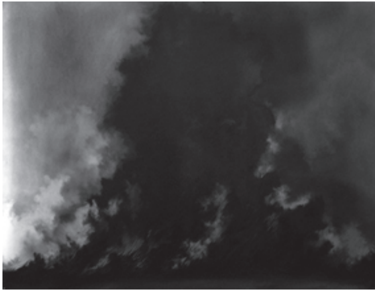
Scène 1 - Le déluge, 2009, 120 x 170cm, dessin à la mine de plomb.