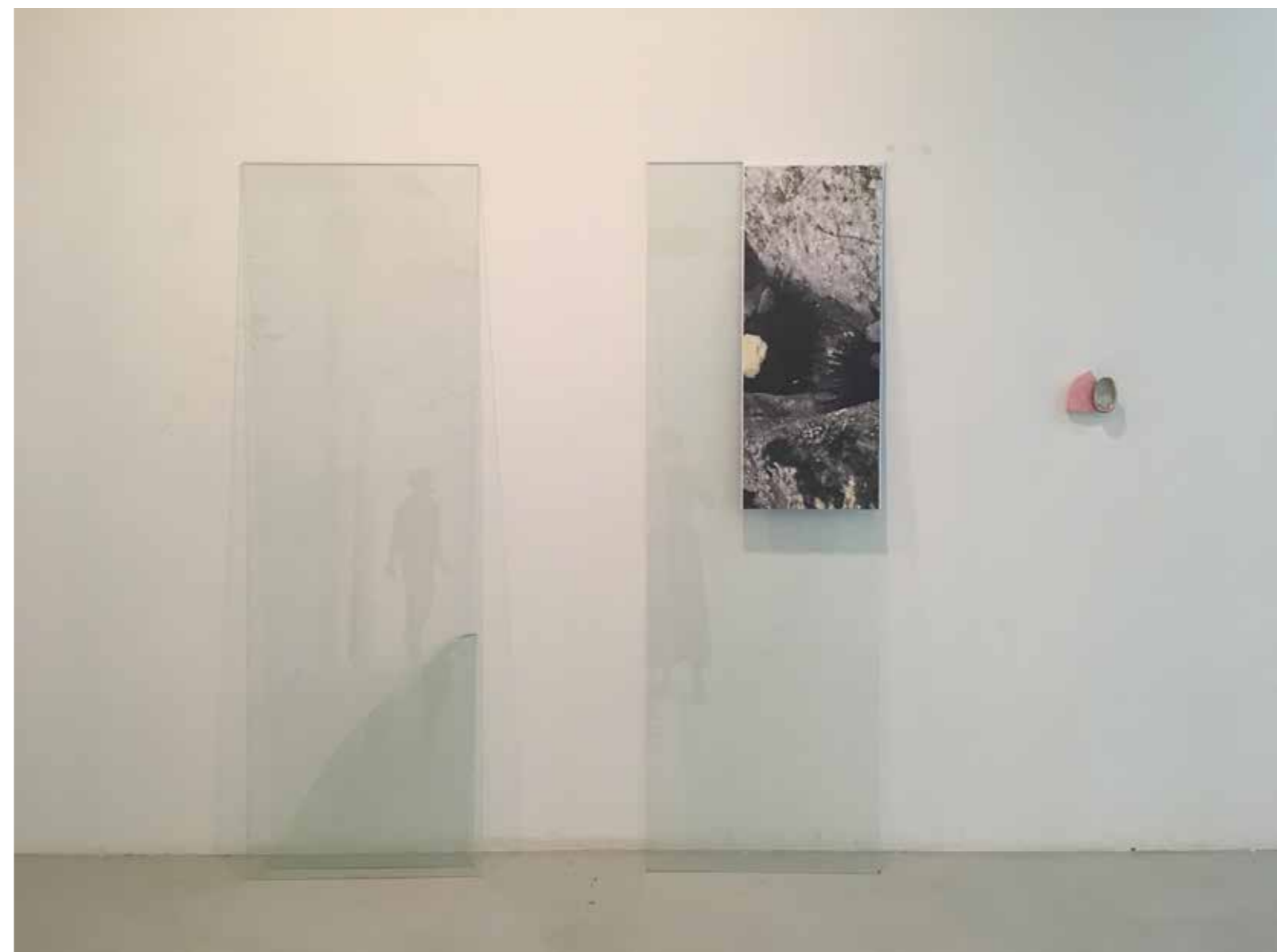
Vue d'accrochage Quimper, DNSEP 2018 Plaques de verre, photographie, sculpture