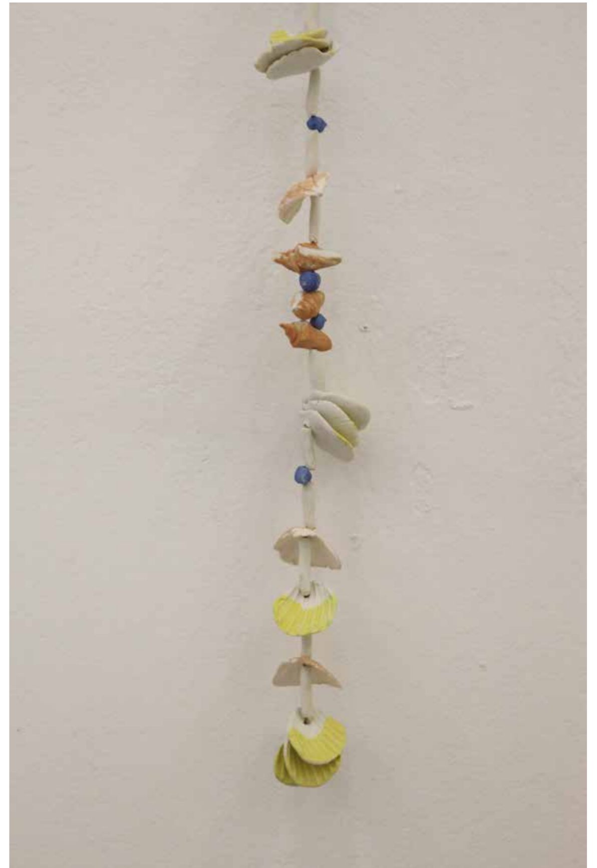
Sans titre, en attendant la vague Porcelaine émaillée, fil de pêche, 2017