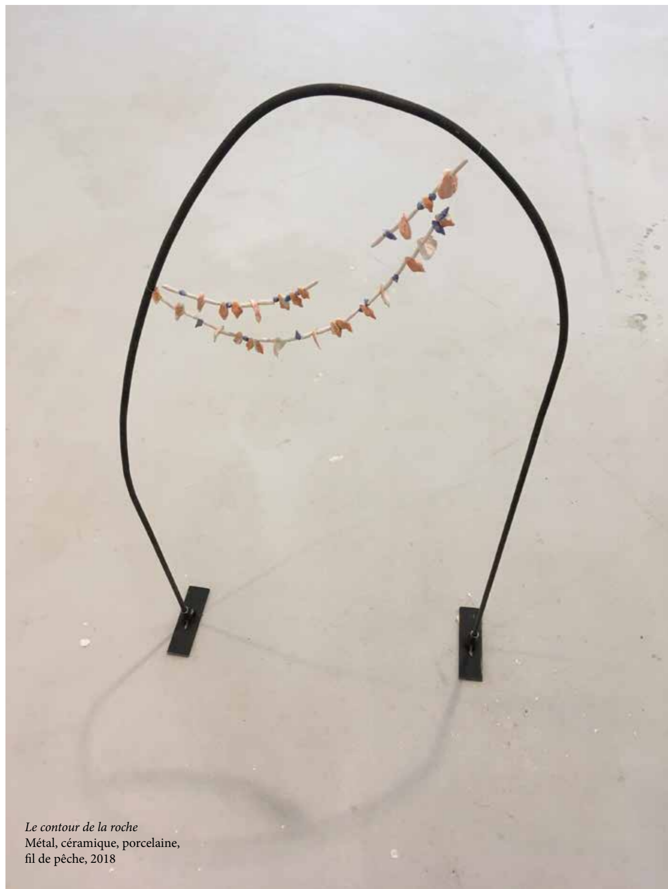
Le contour de la roche Métal, céramique, porcelaine, fil de pêche, 2018