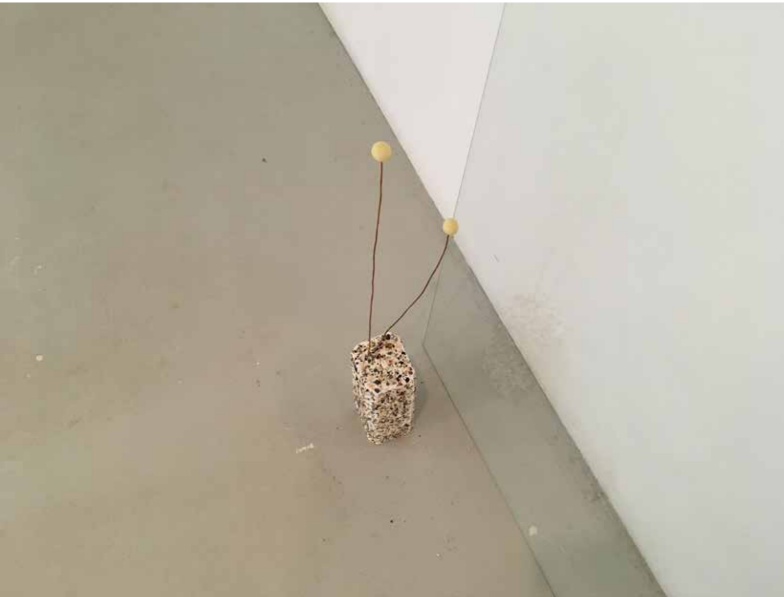
Venus as a boy , 2017 23x14x10 cm (+tige: 50 cm) Polyester, enduit de lissage, brisures de coquillages, gros sel rose, tige de cuivre, céramique émaillée

Lien soundcloud pour écouter ma musique: https://soundcloud.com/ user-247197586