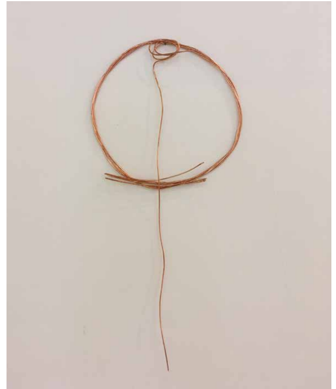
Fleur de cuivre Fils de cuivre 15x35cm, 2017

Sculptures, vidéos-projections, sons, peintures dialoguent au sein de l'installation. J'essaie de rythmer l'espace d'accrochage comme une balade dans ce qu'elle recèle de contemplatif, de poétique et de musical. Comme des plantes aquatiques ondoyantes, les formes de mes sculptures s'inspirent de certaines des formes de la mer, du jardin et du ciel. Je suis sensible aux formes simples, fragiles, bancales, rêveuses, timides. Les reflets, les paillettes, les couleurs font écho à l'attrait des choses qui brillent. Ces figures plus ou moins abstraites proposent une autre réalité, une forme d'utopie du paysage que je voudrais aborder par une variation de techniques (céramique, plâtre, argile, roche, plantes...) touchant la matière de près, ainsi que la sensualité du geste de sculpter.