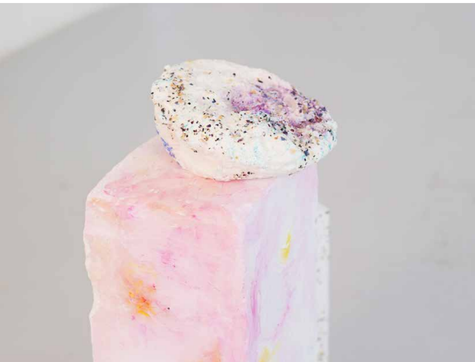
Sans titre Mousse expansive, coquillages, pigments, enduit, pierre ponce, plâtre DNSEP 2018