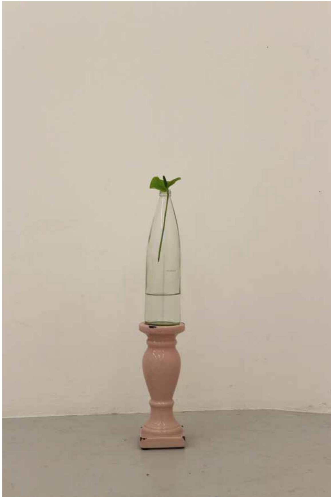
Ikebana minimal Colonne, verre, fleur, eau, 2017