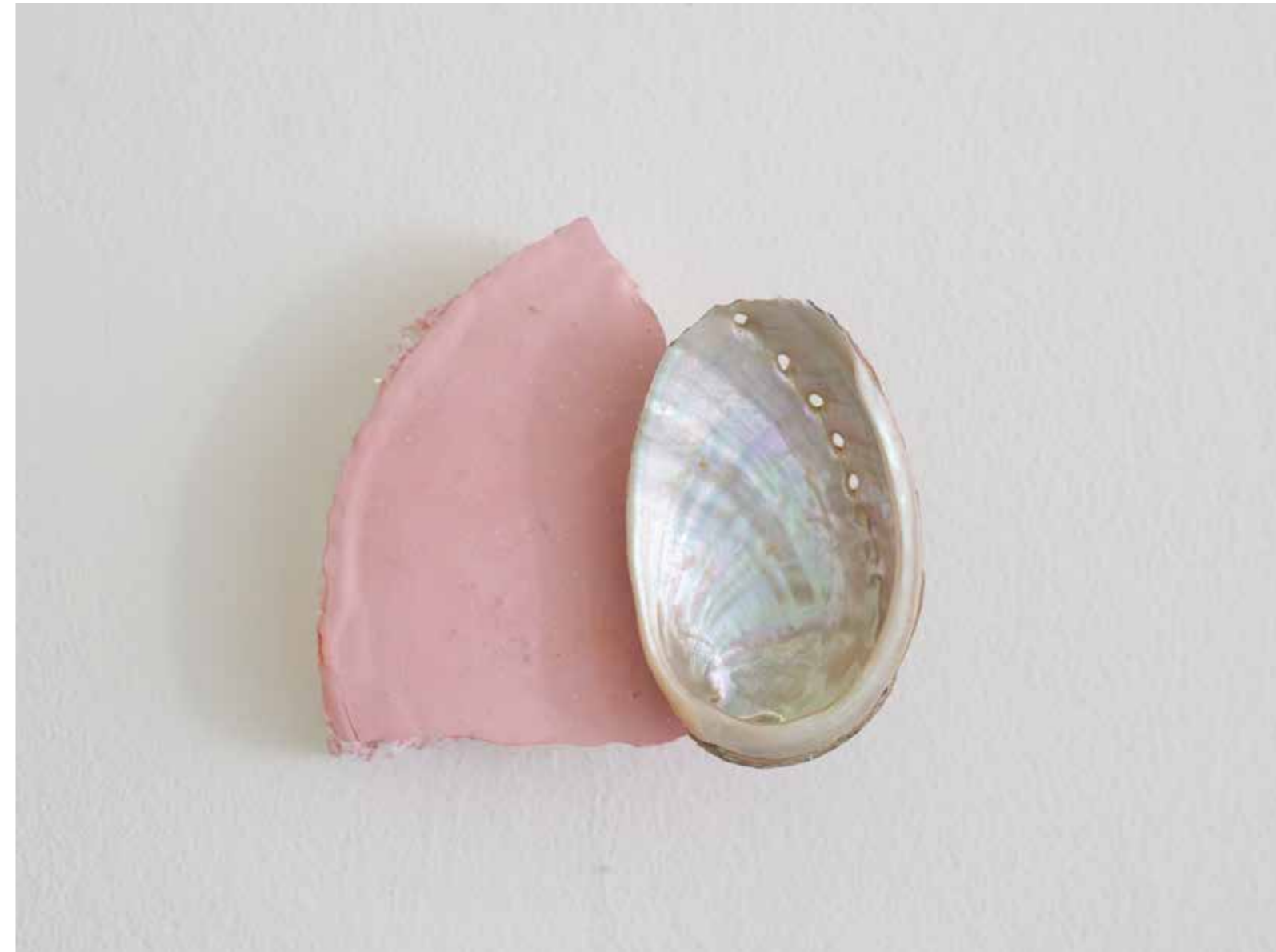
Sans titre Polystyrène, acrylique, ormeau DNSEP 2018 EESAB Quimper