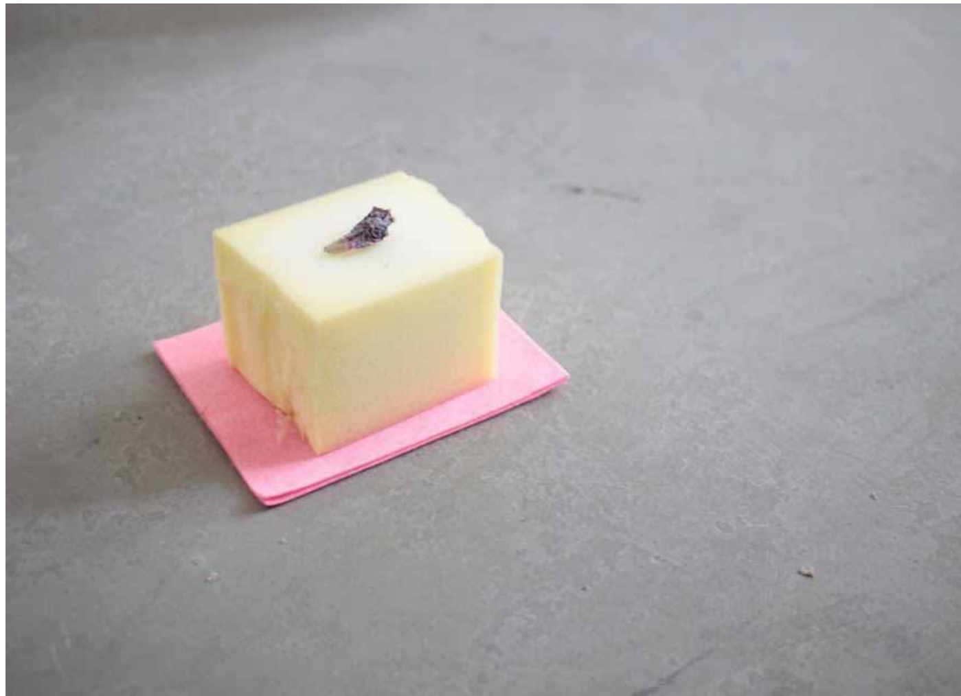
Sans titre , 2016 recherches, Athens school of fine Arts Mousse, figue de barbarie, 20x12cm