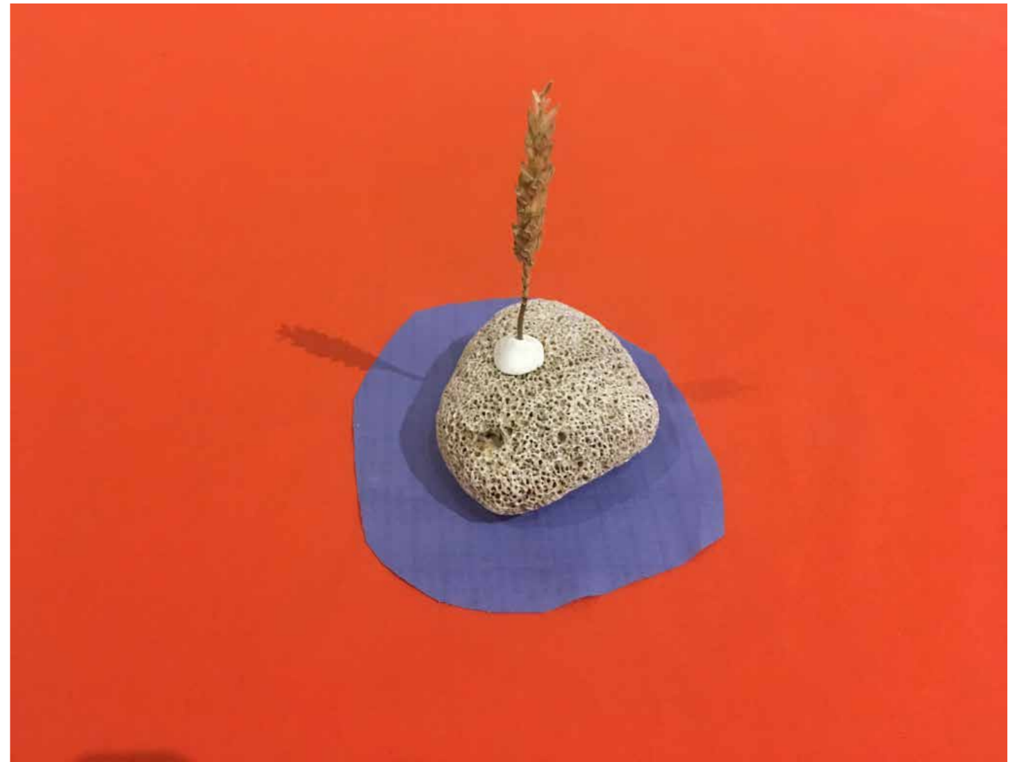
Un brin de blé sur un bout de Corynthe , 2018 Tissu, pierre, argile, blé