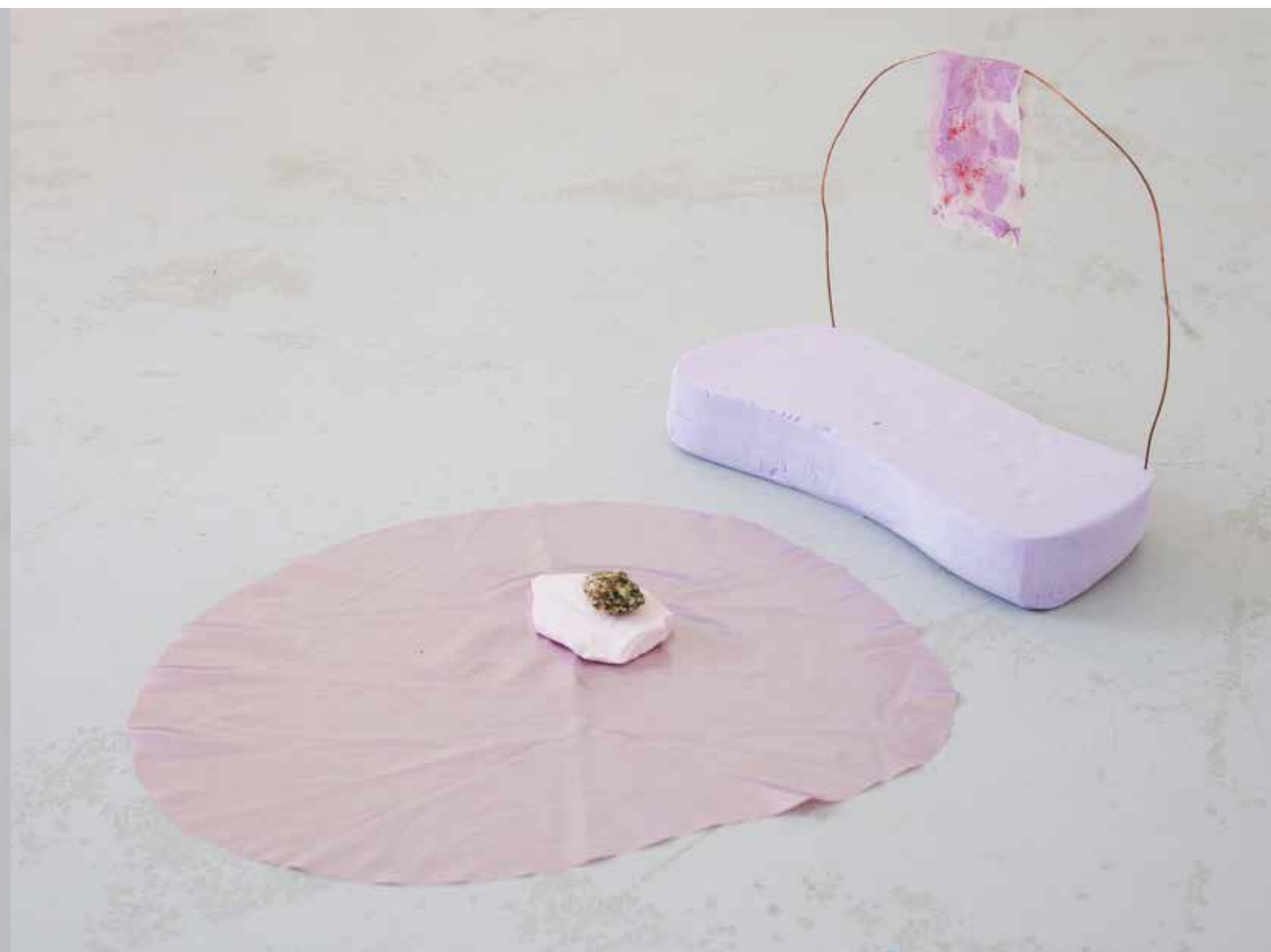
Île Tissu, plâtre, granit rose, polyester, cuivre, soie, sel, pigments DNSEP 2018