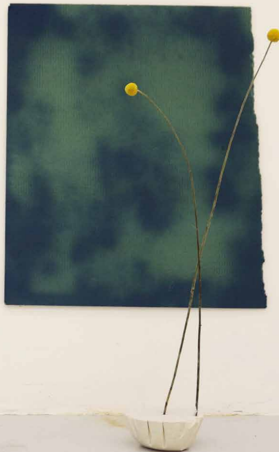
Sans titre , 2017 Carton, bombe, tiges, plâtres 70cm