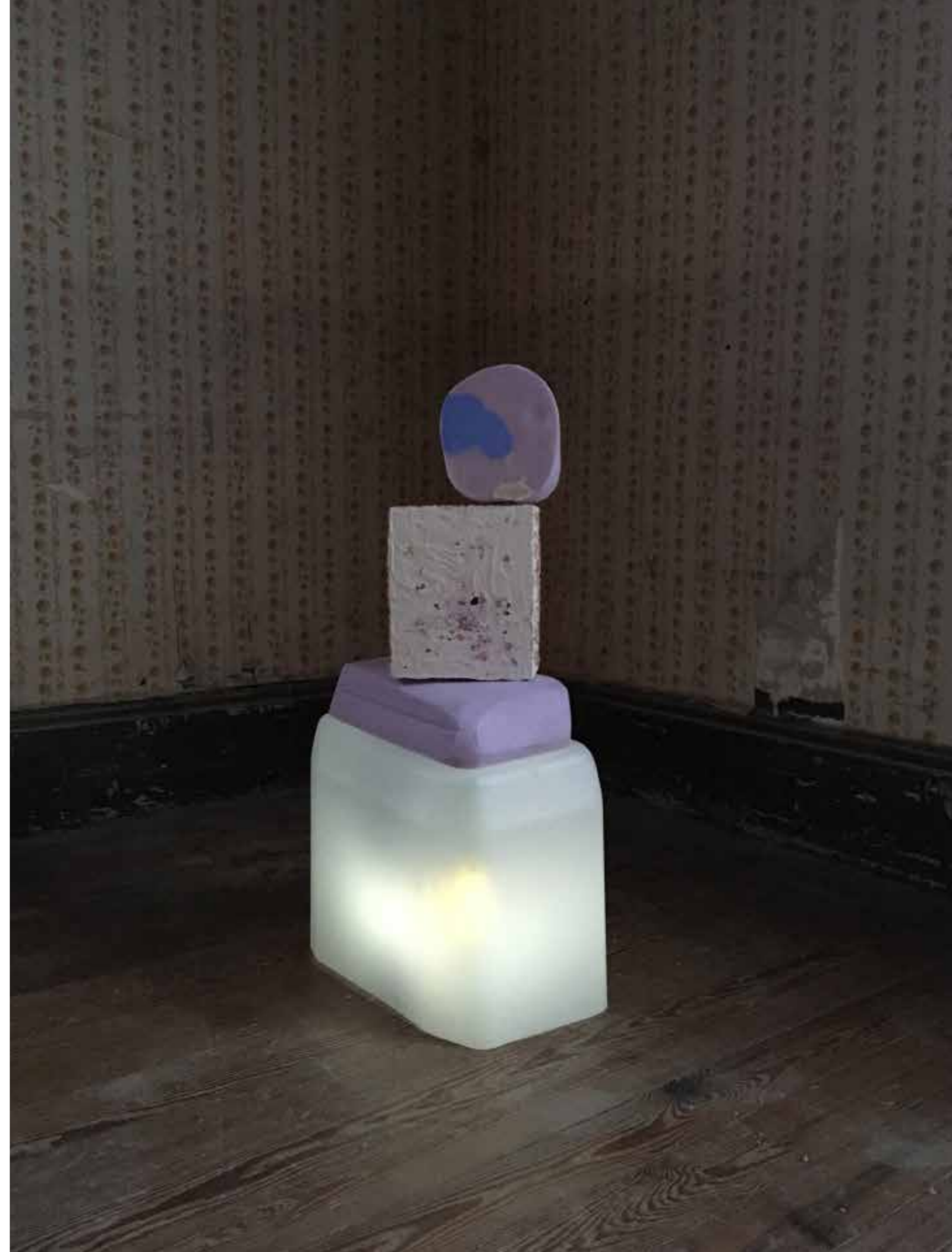
Sans titre , 2018 Plastique, lampe, styrodure, enduit, pigments

VILLA, 2018 Exposition collective à la Villa Rohannec'h