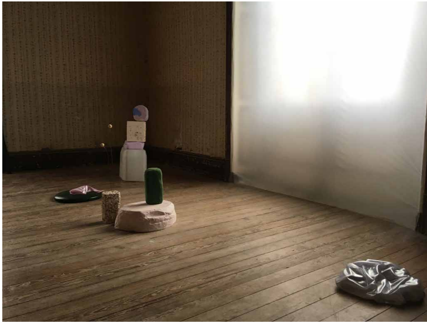
Sans titre , 2018 Installations, sculpture, techniques mixtes et dimensions variables

VILLA, 2018 Exposition collective à la Villa Rohannec'h