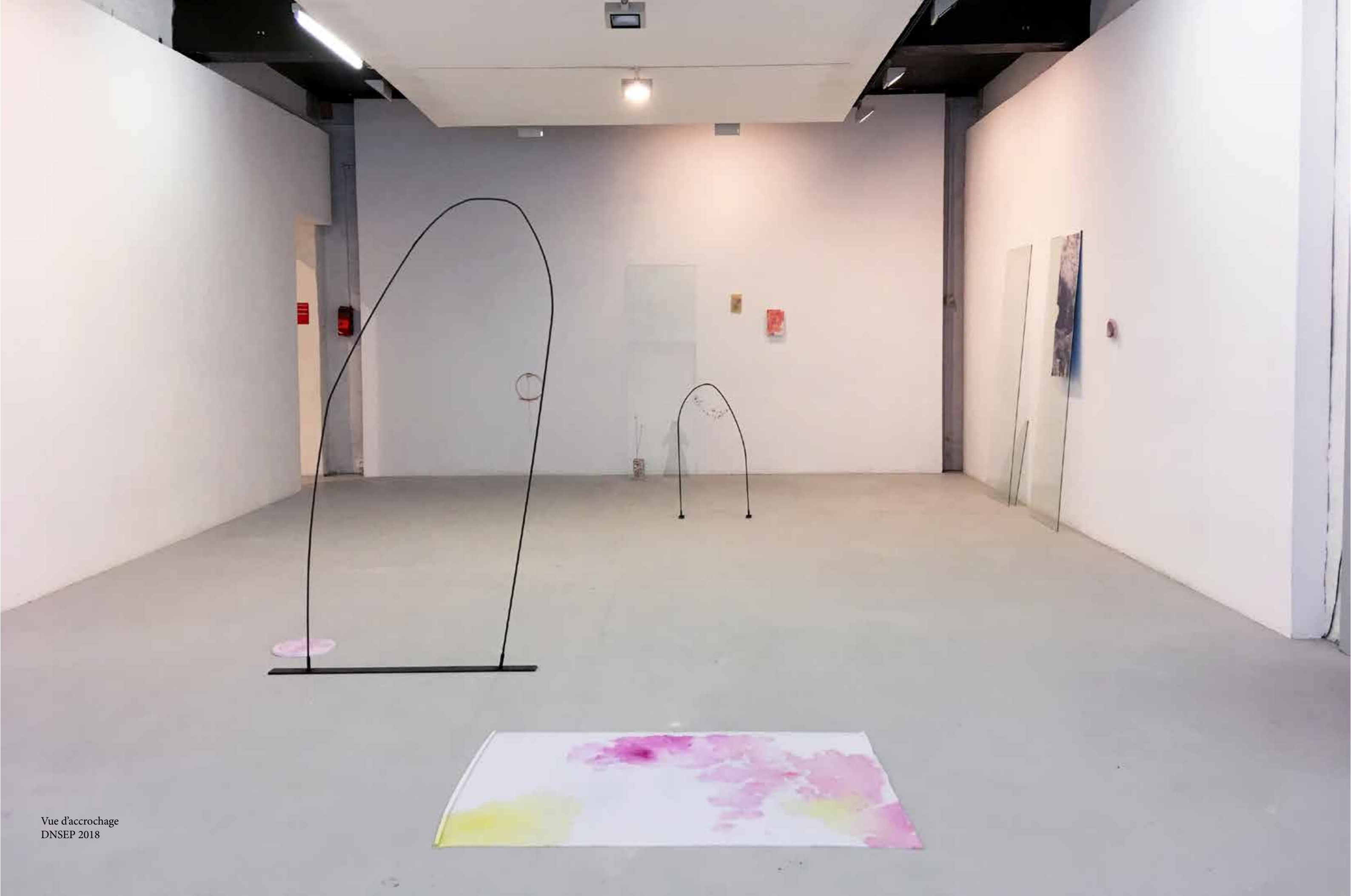
Vue d'accrochage DNSEP 2018