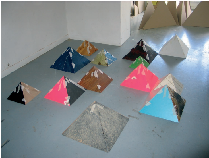
Samir Mougas, Strategy & Tactics , 2009 (détail). Production : 40mcube