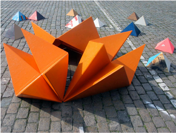
Samir Mougas, Strategy & Tactics , 2009. Production : 40mcube