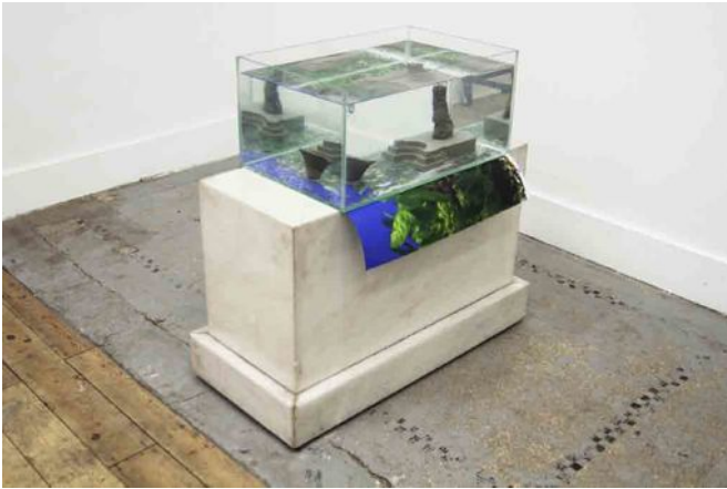
Alan Fertil & Damien Teixidor, Celebrity Tropical Fish #2 , 2013, égatine universelle, verre, marbre, impression numérique, eau, 76 x 36 x 75 cm.