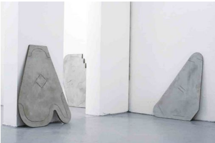
Alan Fertil & Damien Teixidor, Loose Groove , 2012, béton, 100 x 120 x 3 cm (série de 6).