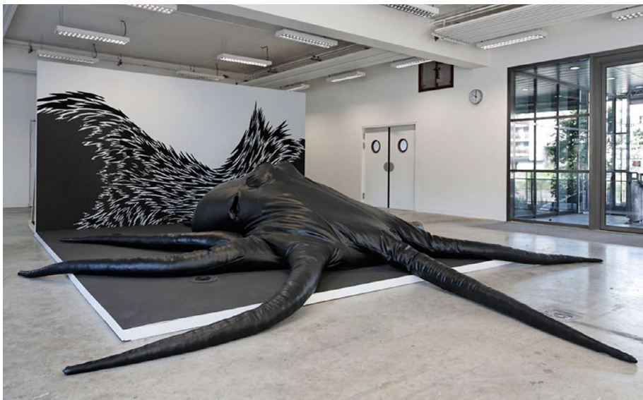
Lina Jabbour, Still life with a skull , 2009. Création sonore : Julien Hô Kim. Le grand atelier, École supérieure d'art de Clermont-Ferrand.