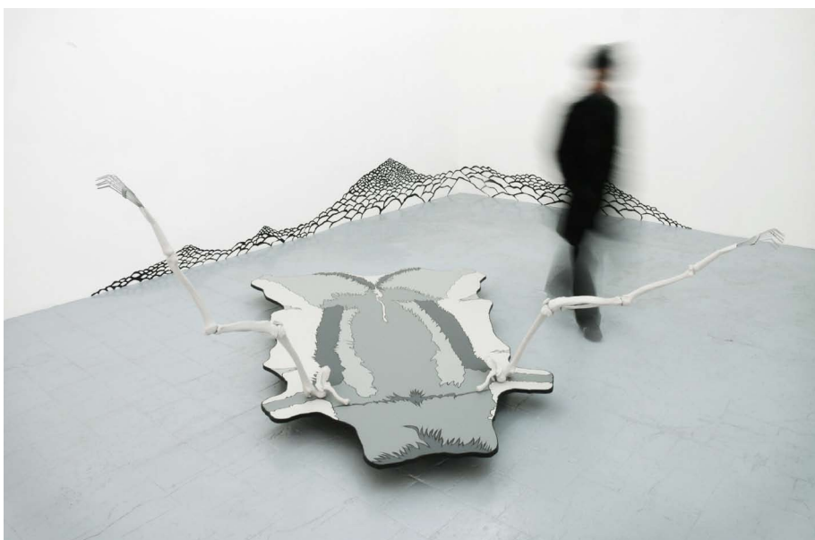
Lina Jabbour, Isidore , 2008. Production Buy-Sellf.