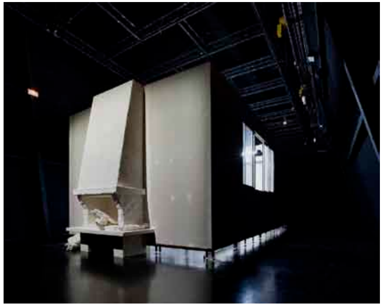
Sarah Fauguet & David Cousinard, Time Line , 2009. Plâtre, BA10, acier, verre, bois. 745 x 450 x 265 cm. Vue de l'exposition Time Line , Tripode (Rézé).