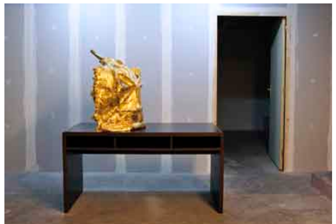
Sarah Fauguet & David Cousinard, Silent Rejection , 2010. Bois, acier, plâtre, feuilles d'or, placages. Dimensions variables. Vue de l'exposition L'État de surface , Instants Chavirés (Montreuil).