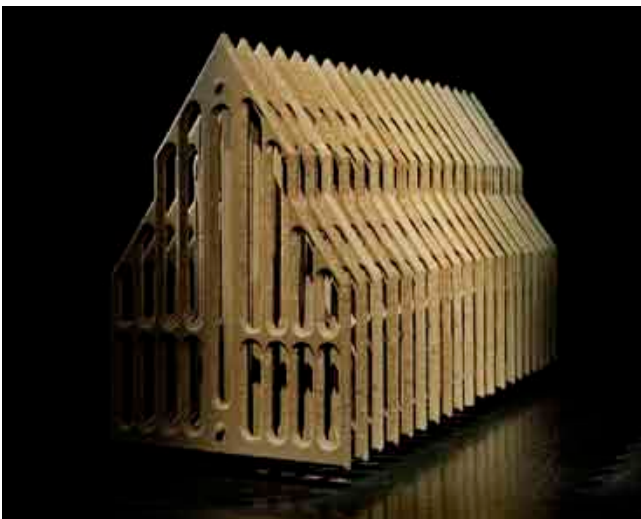
Sarah Fauguet & David Cousinard, Time Line , 2009. Plâtre, BA10, acier, verre, bois. 745 x 450 x 265 cm. Vue de l'exposition Time Line , Tripode (Rézé).