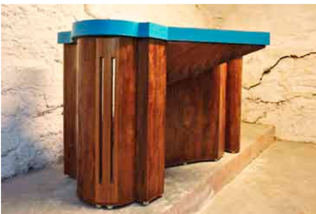
Sarah Fauguet & David Cousinard, Silent Rejection , 2010. Bois, acier, plâtre, feuilles d'or, placages. Dimensions variables. Vue de l'exposition L'État de surface , Instants Chavirés (Montreuil).