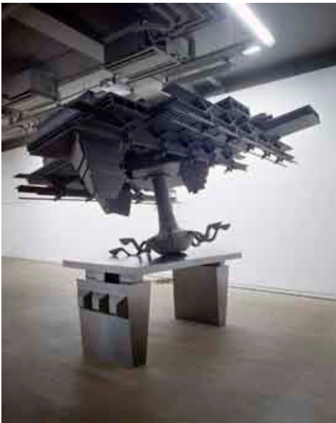
Sarah Fauguet & David Cousinard, Sans titre , 2008. Mdf teinté dans la masse et métal. Vue de l'exposition Et pour quelques dollars de plus... , Fondation d'entreprise Ricard (Paris).