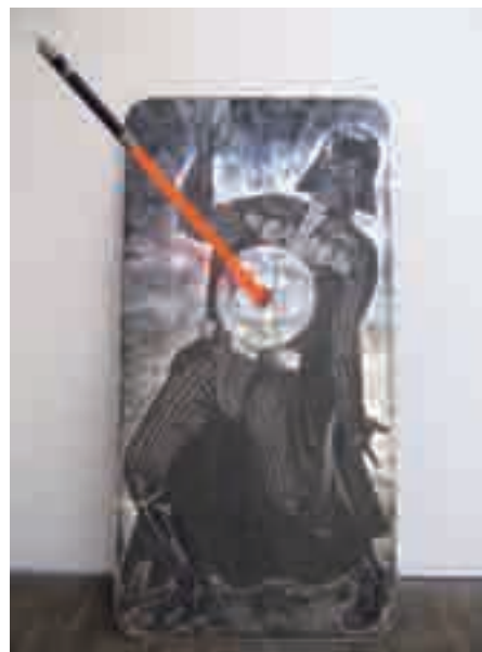
Antoine Dorotte, Darkarakiri , 2007, eau-forte et aquarelle sur zinc, bois, tube fluo, 210 x 100 x 120 cm..