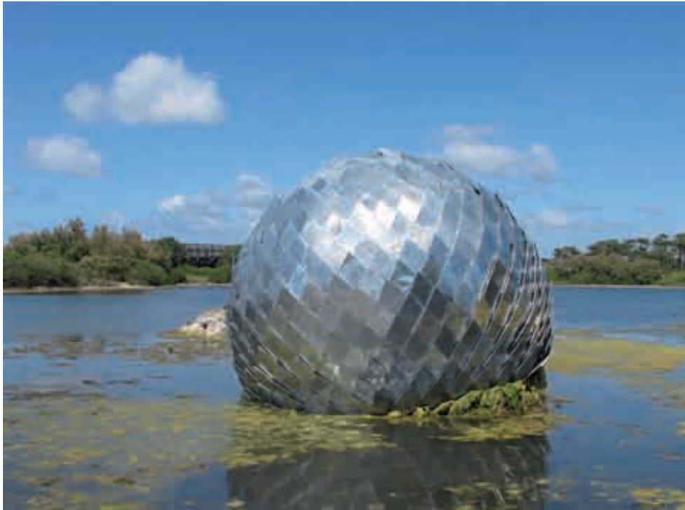
Antoine Dorotte, Una Misteriosa Bola , 2011. Zinc, acier, bois, 500 cm de diamètre. Courtesy galerie ACDC. Photo : Émeric Ducreux.

48 avenue Sergent Maginot, f-35000 Rennes +33 (0)2 90 09 64 11 contact@40mcube.org - www.40mcube.org