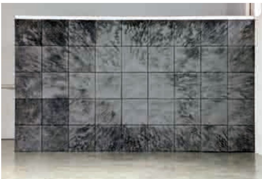
Antoine Dorotte, Blow , 2010, aquarelle sur zinc, 720 x 400 cm. Courtesy galerie ACDC. Photo : Pierre Antoine.