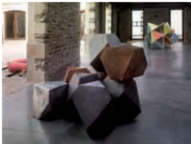
Antoine Dorotte, Amalgama , 2010, aquarelle sur zinc et cuivre. Courtesy galerie ACDC. Photo : André Morin.