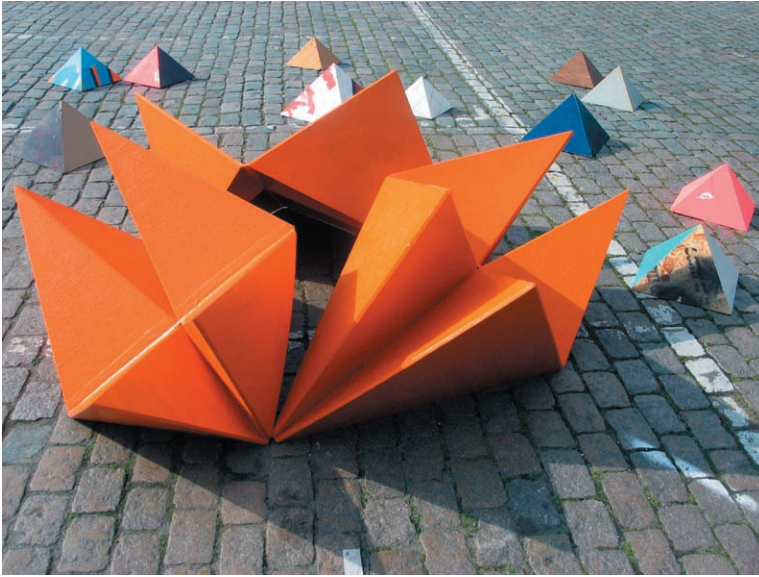
Samir Mougas, Strategy & tactics , 2009. Production : 40mcube