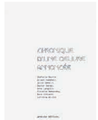
Stéphanie Bourne, Chronique d'une œuvre annoncée , Rennes : 40mcube éditions, 2005. 52 pages Cahiers cousus-collée 13,5 × 18 cm Graphisme : Sofa Design