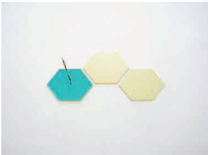
Naïs Calmettes & Rémi Dupeyrat, Acte I , 2039, mousse expansée, tapis de sol et flèche en bambou, dimensions variables.