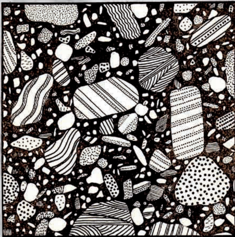
Fig. 10. Composition d'un conglomérat.