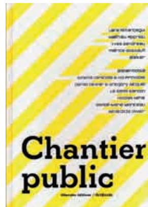
Chantier public , Rennes : 40mcube éditions, 2005. 68 pages Cahiers cousus-collée 15,5 × 21,5 cm Graphisme : Sofa Design