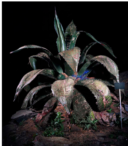
Aurore Valade, SEMPERVIVUM DECORUM / Agave Alain americana communis , 2007. 80 x 65 cm. Tirage lambda.