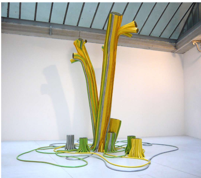
Laurent Perbos, Souche , 2007. Tuyaux d'arrosage en P.V.C. Dimensions variables.