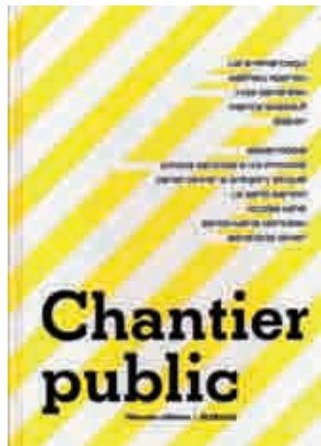
Chantier public , Rennes : 40mcube éditions, 2005. 68 pages Cahiers cousus-collée 15,5 × 21,5 cm Graphisme : Sofa Design