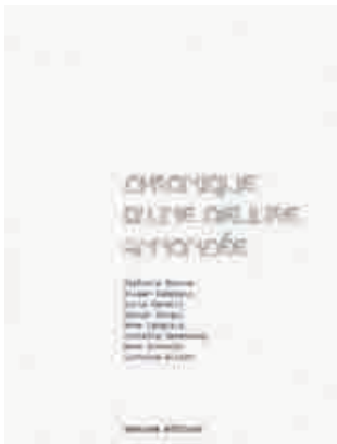
Stéphanie Bourne, Chronique d'une œuvre annoncée , Rennes : 40mcube éditions, 2005. 52 pages Cahiers cousus-collée 13,5 × 18 cm Graphisme : Sofa Design