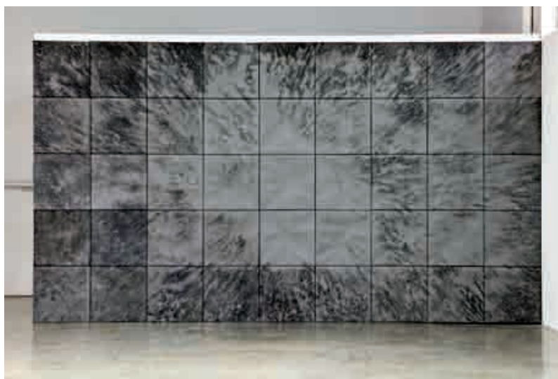
Antoine Dorotte, Blow , 2010, aquatinte sur zinc, 720 × 400 cm.