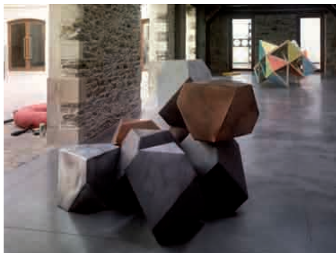
Antoine Dorotte, Amalgamma , 2010, aquatinte sur zinc et cuivre.