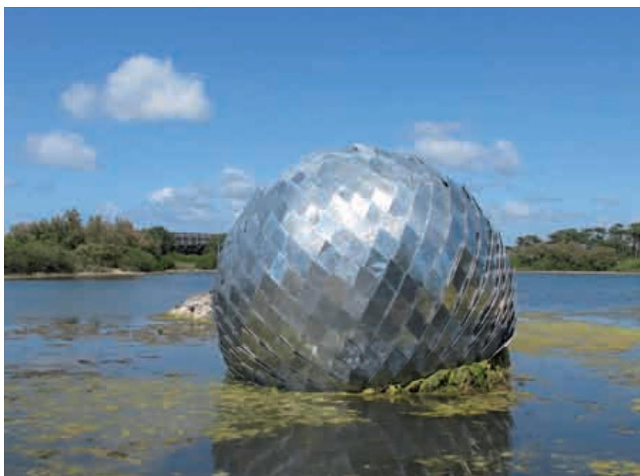
Antoine Dorotte, Una Misteriosa Bola , 2011, zinc, acier, bois, 500 cm de diamètre. Courtesy galerie ACDC. Photo : Émeric Ducreux.