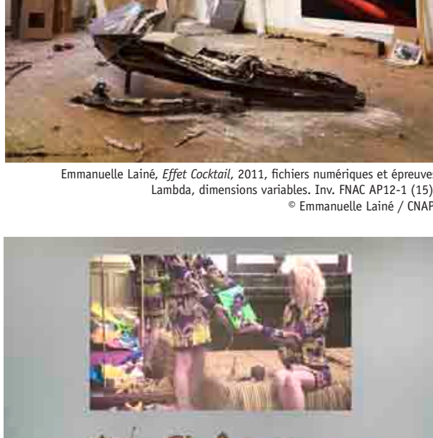
Emmanuelle Lainé, Effet Cocktail , 2011, fichiers numériques et épreuves Lambda, dimensions variables. Inv. FNAC 12-1 (15).

Œuvres de la collection du Centre national des arts plastiques Commissariat : Anne Langlois, 40mcube Exposition coproduite par 40mcube et le CNAP dans le cadre de La Permanence , manifestation conçue et coproduite par le Musée de la danse et le CNAP