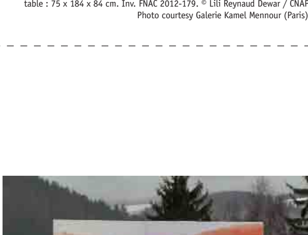
Lili Reynaud-Dewar, Inaccurencies , 2010, installation vidéo, bois, métal, plastique, tissu, rafia, vidéo couleur avec son, lettre encadrée : 37 x 125 cm, table : 75 x 184 x 84 cm. Inv. FNAC 2012-179. © Lili Reynaud Dewar / CNAP. Photo courtesy Galerie Kamel Mennour (Paris).