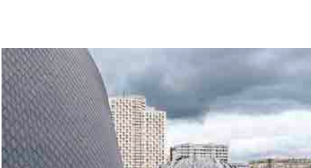
Lang/Baumann, Street Painting #7 , 2013, 59 x 3,8 m, peinture routière.

Dans la continuité de ses présentations d'œuvres dans l'espace public, 40mcube invite Lang/Baumann à réaliser une peinture inévidente sur une rue du centre ville de Rennes. Cette œuvre, véritable explosion de couleurs, est visible pendant un an.