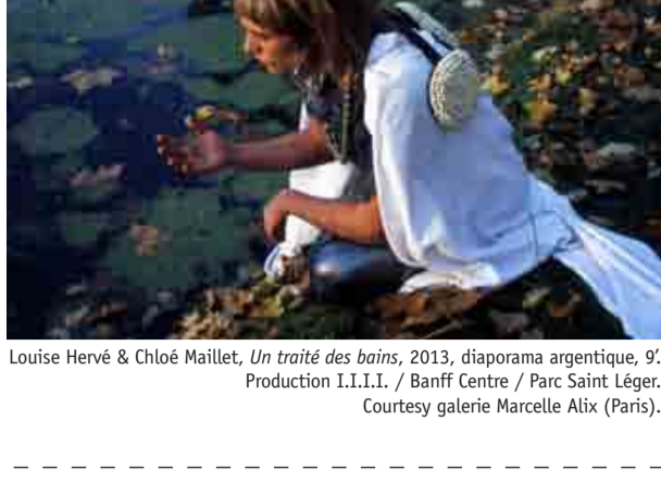
Louise Hervé & Chloé Maillet, Un traité des bains , 2013, diaporama argentique, 9'. Production I.I.I.I. / Banff Centre / Parc Saint Léger.

Dans le cadre de l'exposition Archeologia , Louise Hervé & Chloé Maillet accueilleront en continu les visiteurs pour une performance – permanence liée à leur diaporama Un traité des bains présenté dans l'exposition. Sous forme de visite commentée, les artistes mêlent éléments historiques et anticipation autour du thème de l'eau et de son rôle aussi bien dans la préservation de vestiges archéologiques que dans la thérapie de maladies liées au vieillissement.