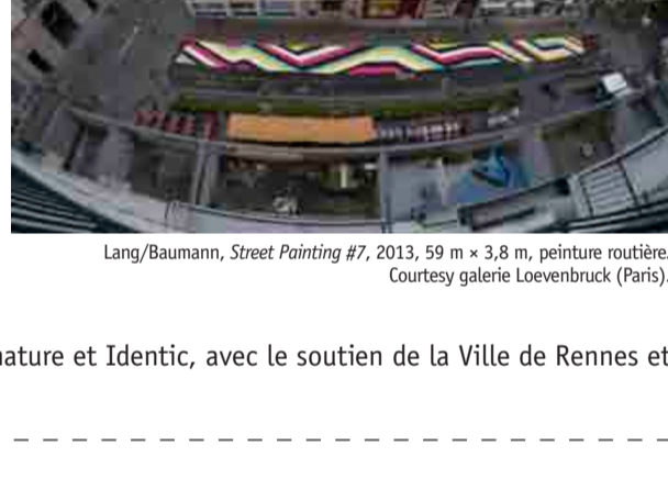
Lang/Baumann, Street Painting #7 , 2013, 59 m x 3,8 m, peinture routière.

Les œuvres du duo Lang/Baumann prennent place dans les espaces d'exposition mais aussi dans des espaces publics, sur des architectures et dans la ville qui en deviennent le support.