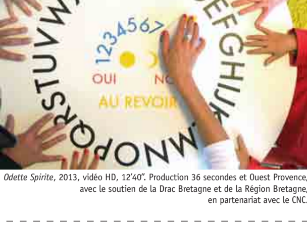
Odette Spirite , 2013, vidéo HD, 12'40". Production 36 secondes et Ouest Provence, avec le soutien de la Drac Bretagne et de la Région Bretagne, en partenariat avec le CNC.

Installés en cercle, des personnages manipulent une table de ouija. Ils entrent en contact avec Odette, une revenante qui ne peut s'exprimer qu'avec des mots écrits car elle n'a plus l'usage de la parole. À l'aide de la tablette, elle parvient à expliquer qu'elle ne peut rejoindre le monde des morts, ni revenir dans celui des vivants car « il lui manque une lettre ». Odette part en quête de sa lettre et de son identité sur les routes du bord du monde.