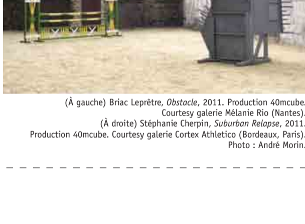
(À gauche) Briac Leprière, Obstacle , 2011. Production 40mcube. Courtesy galerie Mélanie Rio (Nantes). (À droite) Stéphanie Cherpin, Suburban Relapse , 2011. Production 40mcube. Courtesy galerie Cortex Athletico (Bordeaux, Paris). Photo : André Morin.

Le Parc de sculptures urbain regroupe actuellement 12 œuvres et du mobilier réalisé par le designer Erwan Mével.