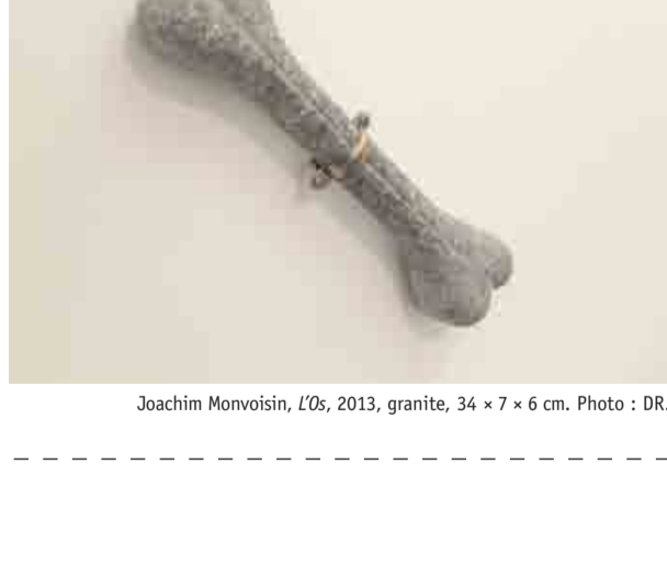
Joachim Monvoisin, L'Os , 2013, granite, 34 x 7 x 6 cm.

Joachim Monvoisin réalise un travail de dessin et crée des sculptures et des installations narratives entre bricolage et souvenirs d'enfance où maquettes, personnages et événements se déploient un sans humeur. 40mcube met à sa disposition un espace de travail et un atelier de fabrication durant l'année 2012-2013.