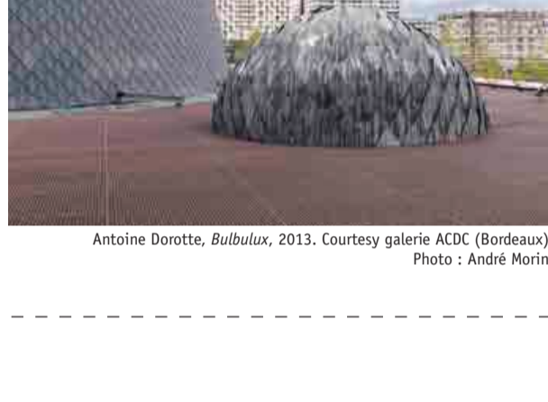
Antoine Dorotte, Bulbulux , 2013. Courtesy galerie ACDC (Bordeaux). Photo : André Morin.

Antoine Dorotte investit les espaces communs du bâtiment de Christian de Portzamparc. Dialoguant avec l'architecture, les deux œuvres présentées par l'artiste, Bulbulux et Una Misteriosa Bola , apportent une dose de science-fiction et proposent un parcours et une démultiplication des points de vue.