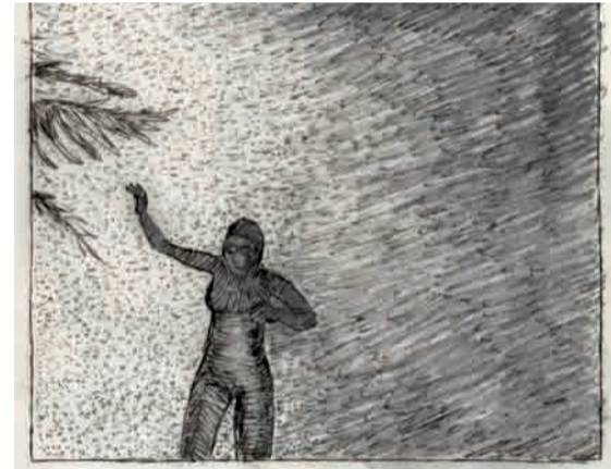
Whirlwind Riding , 2012. Dessin préparatoire.

Whirlwind Riding , 2012, vidéo, 36", eau-forte et aquarelle sur zinc. Production 36", avec l'aide de la région Bretagne.