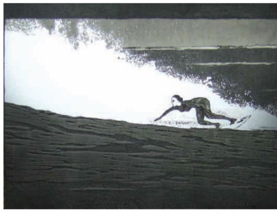
Move it Piano , 2009.

Move it Piano , 2009, film 16mm transféré sur dvd, 6", eau-forte et aquarelle sur zinc. Coproduction Le Fresnoy et Drac Bretagne.