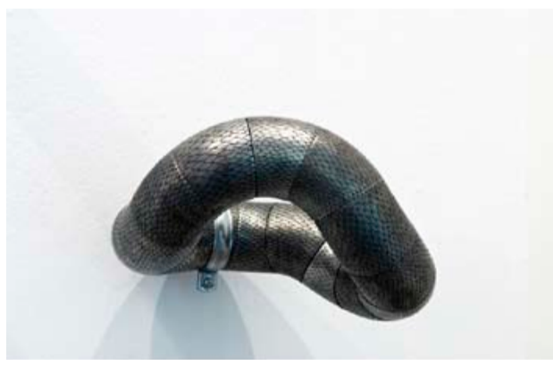
Antoine Dorotte, Suite d'O , 2010. Eau-forte sur zinc. Dimensions variables. Courtesy de l'artiste / Galerie ACDC (Bordeaux). Photo : Pierre Antoine.