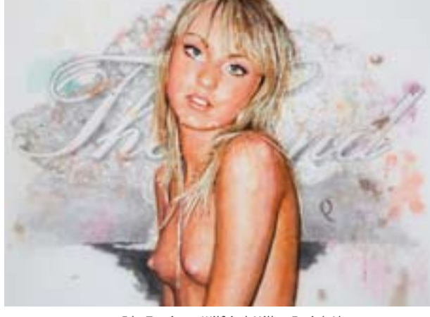
Ida Tursic et Wilfried Mille, Facial Abstract 2 , 2010.

Pour leur exposition à 40mcube, Ida Tursic et Wilfried Mille font la part belle à ces représentations issues du hasard qui exploitent les résidus liés à la fabrication de leurs toiles. Reproduites au format de 200 x 250 cm, elles sont hissées au rang de peintures et nivelées à leurs autres séries, rappelées ici par une seule toile figurative : le portrait d'une jeune fille alanguie, torse nu, derrière laquelle on devine le « The End » des films hollywoodiens.