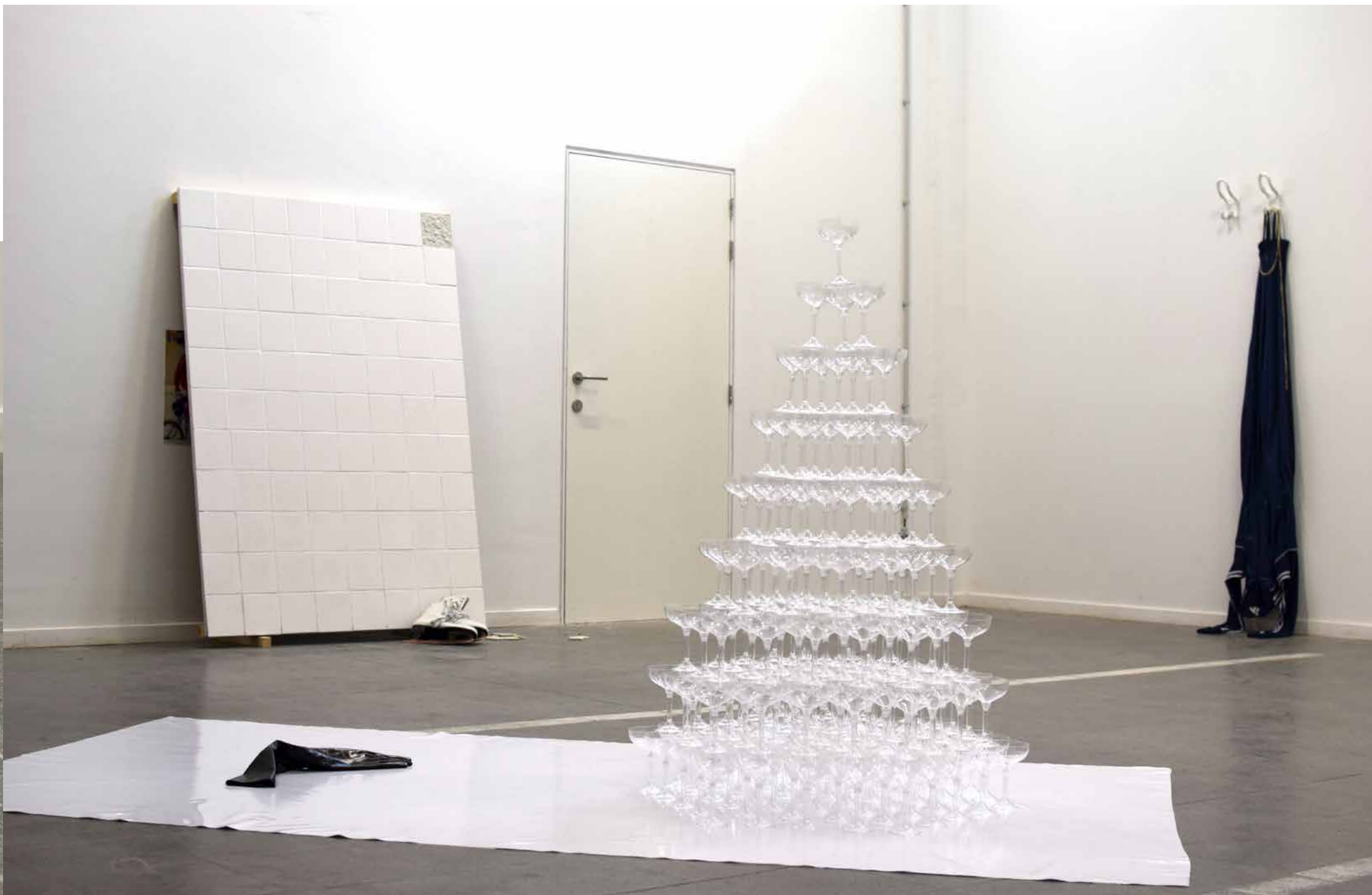
Vue de l'exposition BRUNO , ERG, 2016