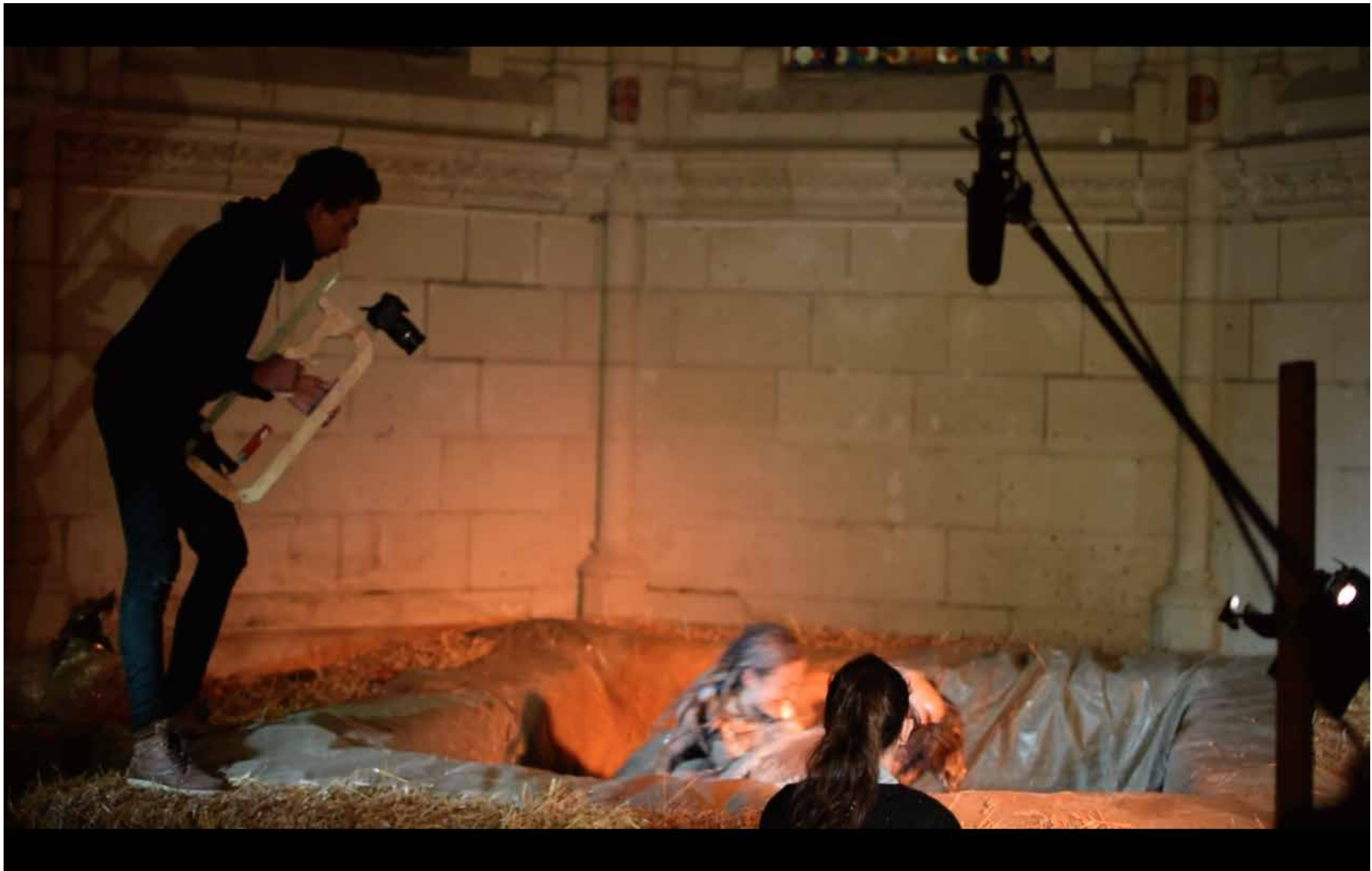
Faire des victimes , performance, film, documentaire, résidence AGEN- DA, centre d'art Chapelle Jeanne d'Arc, Thouars (86), Février 2016