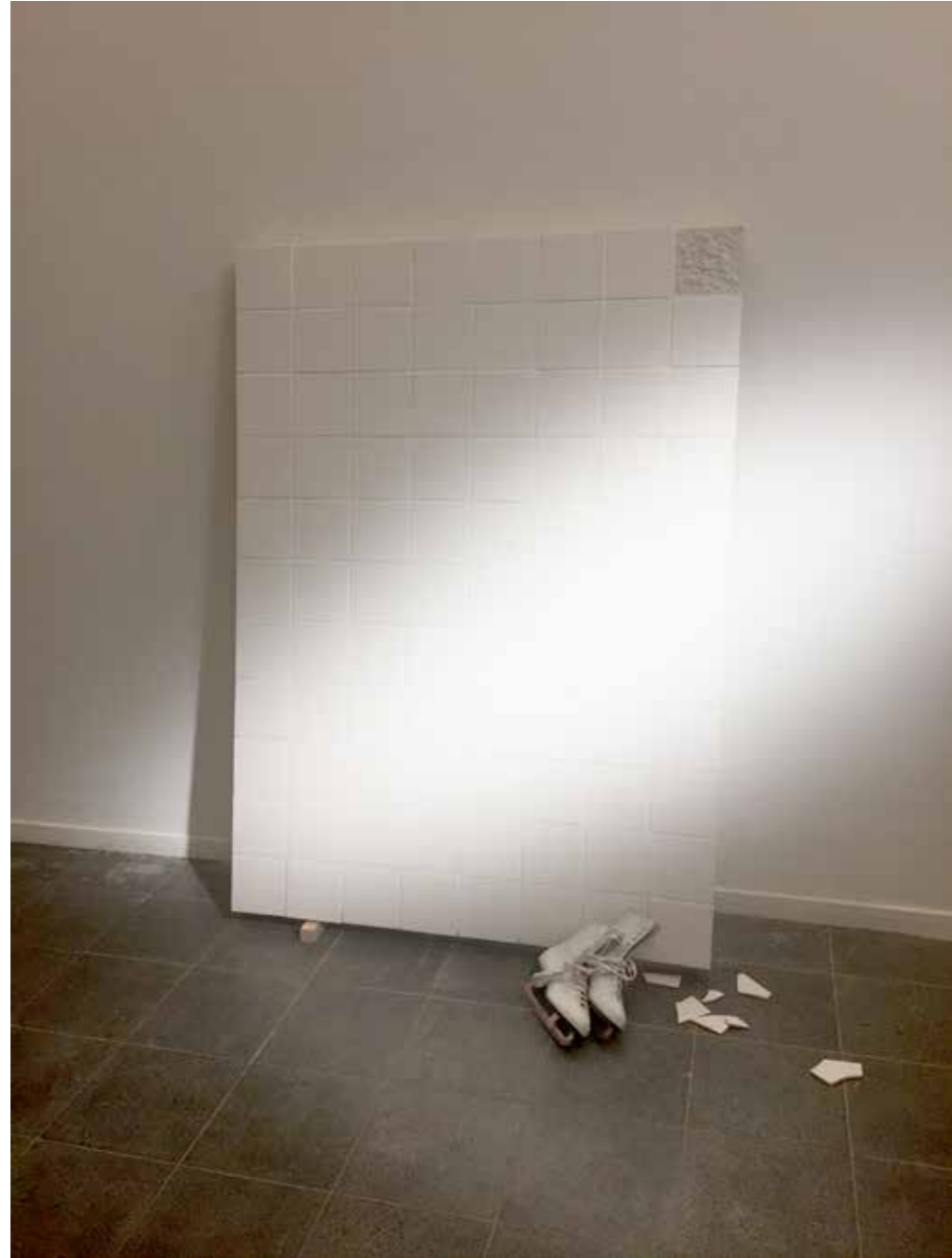
Bruno, l'hiver , carrelage sur structure de bois, patins à glace limés, dimensions variables, 2015